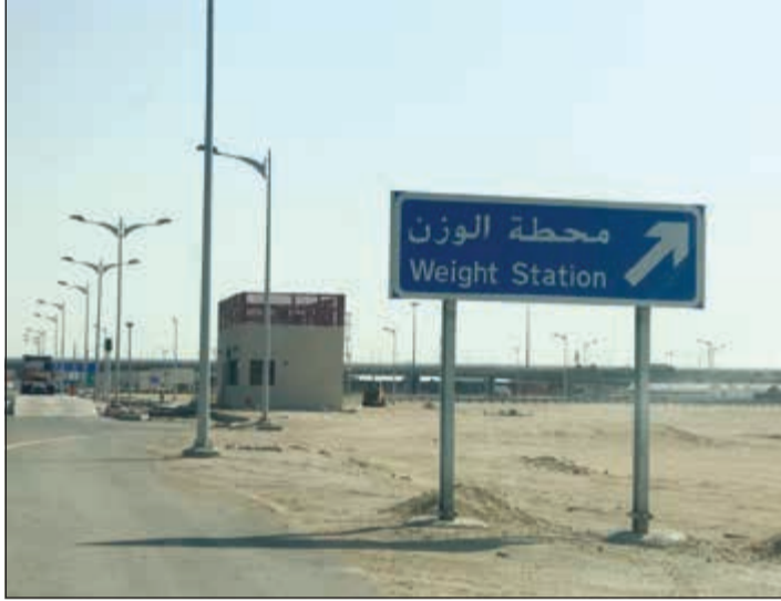
مدخل محطة الوزن

■ الوزن ودفع الرسوم سيتمان في محطات أوزان الشاحنات قبل الدخول إلى الجسر