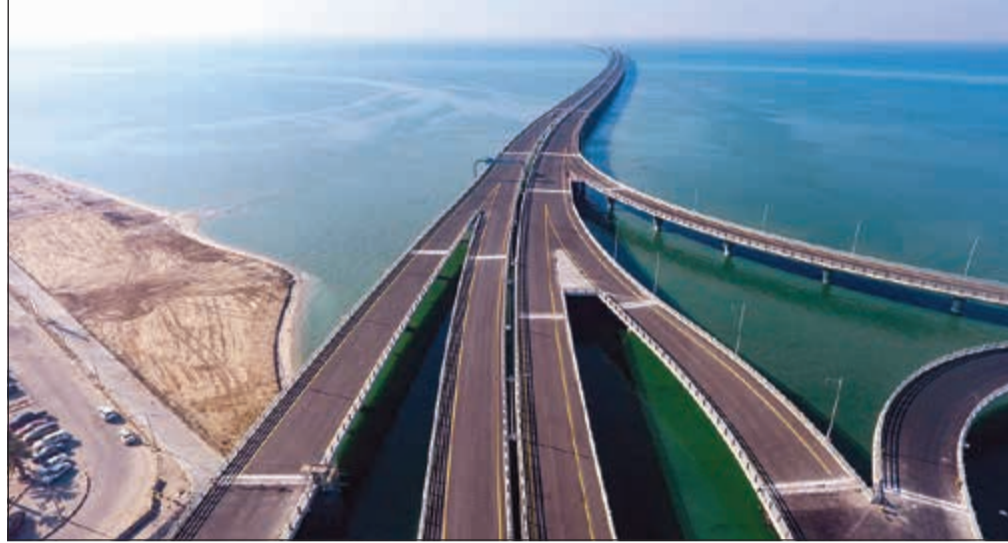
عائدات الرسوم ستستخدم في تغطية جزء من تكلفة أعمال الصيانة والتشغيل للجسر