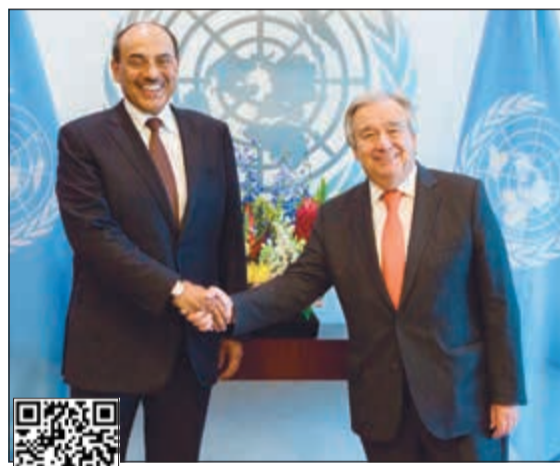
الشيخ صباح الخالد مستقبلاً الأمين العام للأمم المتحدة أنطونيو غوتيريس

نيويورك - كونا: أكد نائب رئيس مجلس الوزراء وزير الخارجية الشيخ صباح الخالد ان اعتماد مجلس الأمن لمشروع القرار الكويتي لحماية المدنيين والمفقودين في النزاعات المسلحة يعد إنجازاً للدبلوماسية الكويتية وإشادة عالمية بمساعيها، مؤكداً العزم على تعزيز جهود المجتمع الدولي في حفظ الأمن والسلم ودعم السلام والتنمية الشاملة في العالم. وقد نالت الكويت إشادات عالمية متعددة، لاسيما من مندوبي الدول الأعضاء في مجلس الأمن وعدد من المنظمات العالمية على هذا النجاح الدبلوماسي وهذه الخطوة الإنسانية الفريدة من نوعها. وفي هذا السياق، أكد ممثل أميركا جوناثان كوهين ان القرار أول دعوة جماعية للمجلس المتحددة مسالة المفقودين في الصراع. بدوره، ذكر ممثل المملكة المتحدة جوناثان إلين ان اعتماد القرار يهدف إلى تعزيز التعاون الدولي ويستند إلى الآليات القائمة ويلاحظ المسؤولية الأساسية للدول على حماية المدنيين. من جانبه، رحب ممثل فرنسا فرانسوا ديلايتر بالقرار، داعياً إلى التعاون مع اللجنة الدولية للصليب الأحمر للوصول إلى المعلومات المتعلقة بالاحتجزين. التفاصيل ص 9