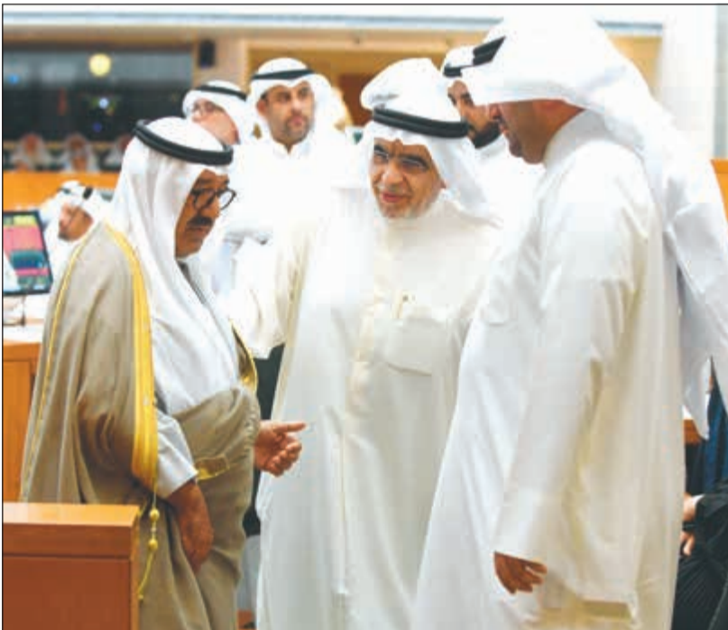
الشيخ ناصر صباح الأحمد في حديث مع الوزير خالد الروضان والنائب عدنان عبدالصمد في قاعة عبدالله السالم أمس