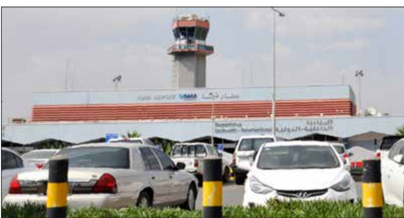
سيارات مصطفة في مواقف مطار أبها الدولي أمس

عواصم - وكالات: تعهد تحالف دعم الشرعية في اليمن، بإجراءات «رادعة وصارمة»، رداً على الاعتداء الحوثي على مطار أبها الدولي الذي أدى لإصابة 26 مدنياً من جنسيات مختلفة بجروح في انفجار «مقدوف»، أطلقه الانقلابيون على مطار أبها في جنوب غرب السعودية. وقد أعربت وزارة الخارجية عن إدانة واستنكار الكويت الشديدين للاعتداء الإجرامي الأثم. وأوضح أنه يمثل تصعيداً خطيراً وتقويضاً للجهود المبذولة للوصول إلى حل سياسي. وأكدت وقوف الكويت التام إلى جانب الأشقاء في المملكة وتأييدها ومساندتها لها