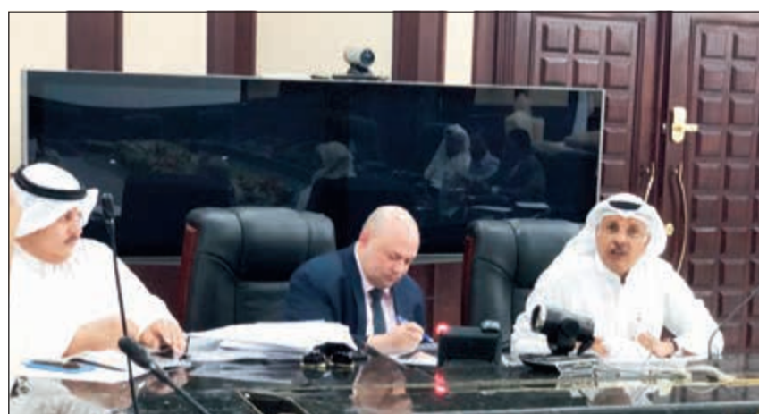
جانب من عمومية «الوطنية للمسالخ»