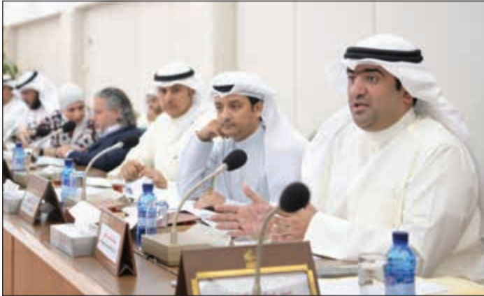
خالد الروضان وأركان وزارته اثناء الاجتماع

وقال ان المشاريع الصغيرة والمتوسطة هي الركيزة الأساسية لبناء الاقتصاد الوطني المتين للدولة، مشيراً إلى أن الدول التي يشارك شبابها في التنمية الاقتصادية كانت الأكثر قدرة على تجاوز الأزمة التي حدثت في 2008، وتميز اقتصادها بالثبات والقوة. وأضاف الكندري أن أعضاء اللجنة أدوا واجهم تجاه شباب المباردين باتاحة الفرصة لهم للدخول في مشاريع الدولة، متمنيا أن تعود تلك المشاريع عليهم بالمنفعة المادية والمعنوية وتقديم ما هو أفضل للكويت. وكان المجلس قد وافق في جلسة 15 مايو الماضي في المداولة الأولى على الاقتراح بقانون بتعديل بعض أحكام القانون رقم 49 لسنة 2016 بشأن المناقصات العامة، ومشروع قانون في شأن تنظيم التأمين والإشراف والرقابة عليه.