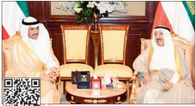
صاحب السمو الأمير الشيخ صباح الأحمد مستقبلاً رئيس مجلس الأمة مرزوق الغانم