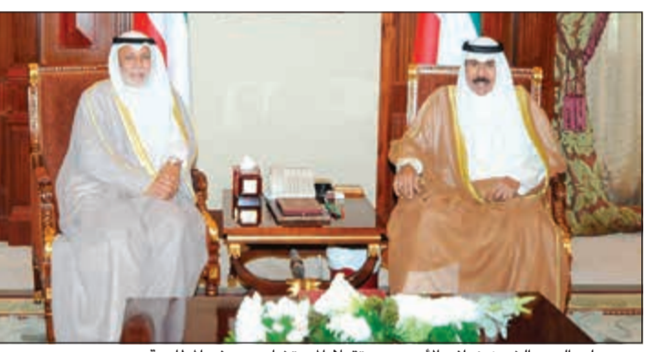
سمو ولي العهد الشيخ نواف الأحمد مستقبلاً المستشار يوسف المطاوعة

التميز ورئيس المحكمة الدستورية المستشار يوسف المطاوعة. كما استقبل سموه نائب رئيس مجلس الوزراء وزير الدولة لشؤون مجلس الوزراء أنس الصالح.