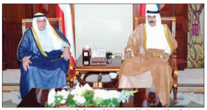
سمو ولي العهد الشيخ نواف الأحمد مستقبلاً الشيخ خالد الجراح