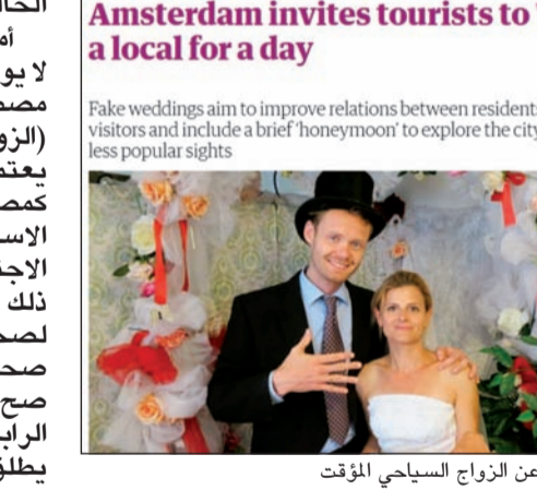
خبير «الغارديان» عن الزواج السياحي المؤقت