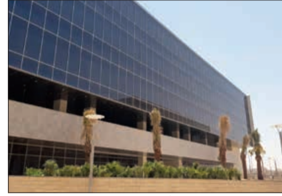
الكلية الأميركية الدولية صرح أكاديمي شامخ

الكوادر التعليمية والإدارية عالية قادرة على تحقيق يمتنعون بخبرات ومؤهلات أهداف هذا الصرح الكبير