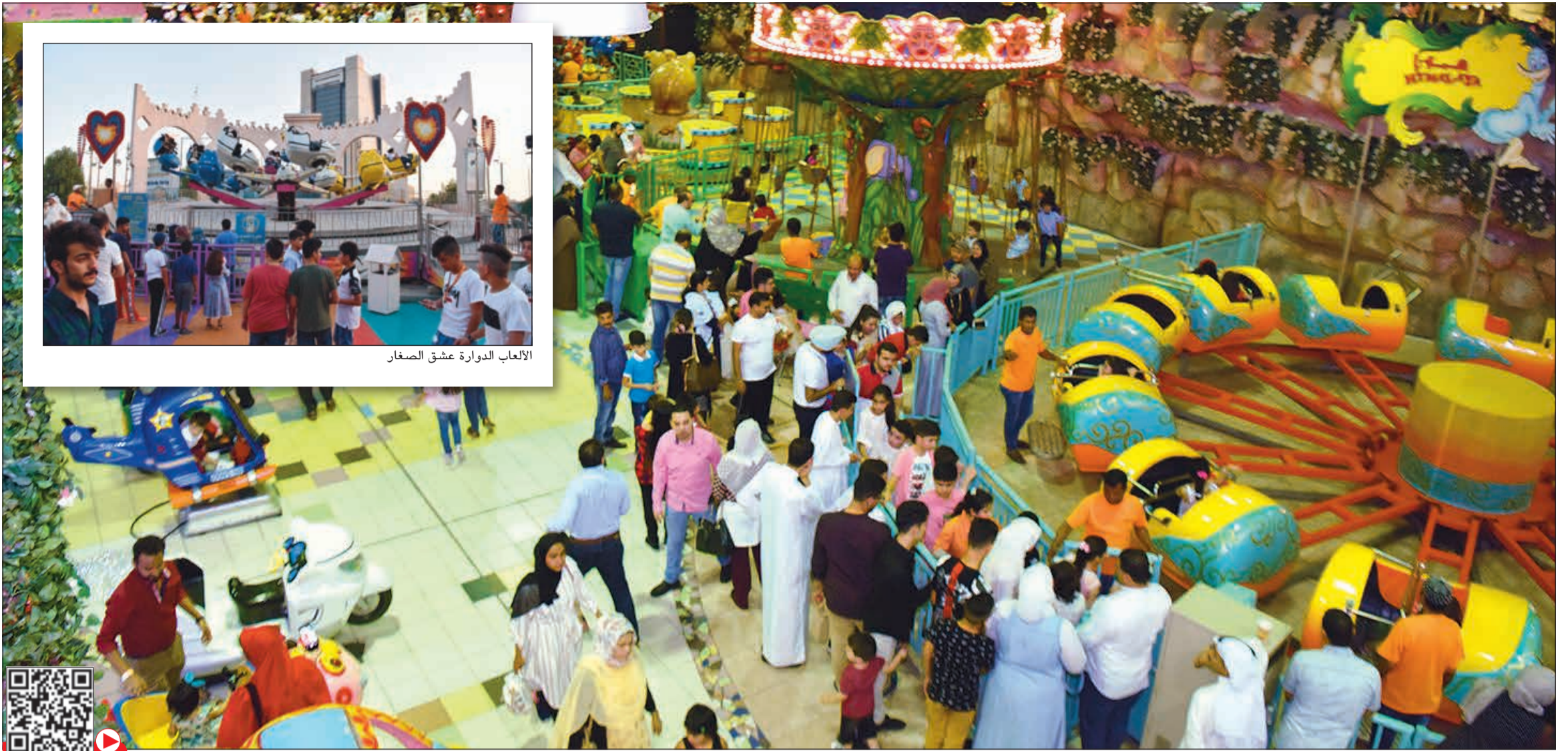
الألعاب الدوارة عشق الصغار