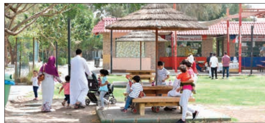
حديقة الحيوان مكان لقضاء أوقات ممتعة بالعيد