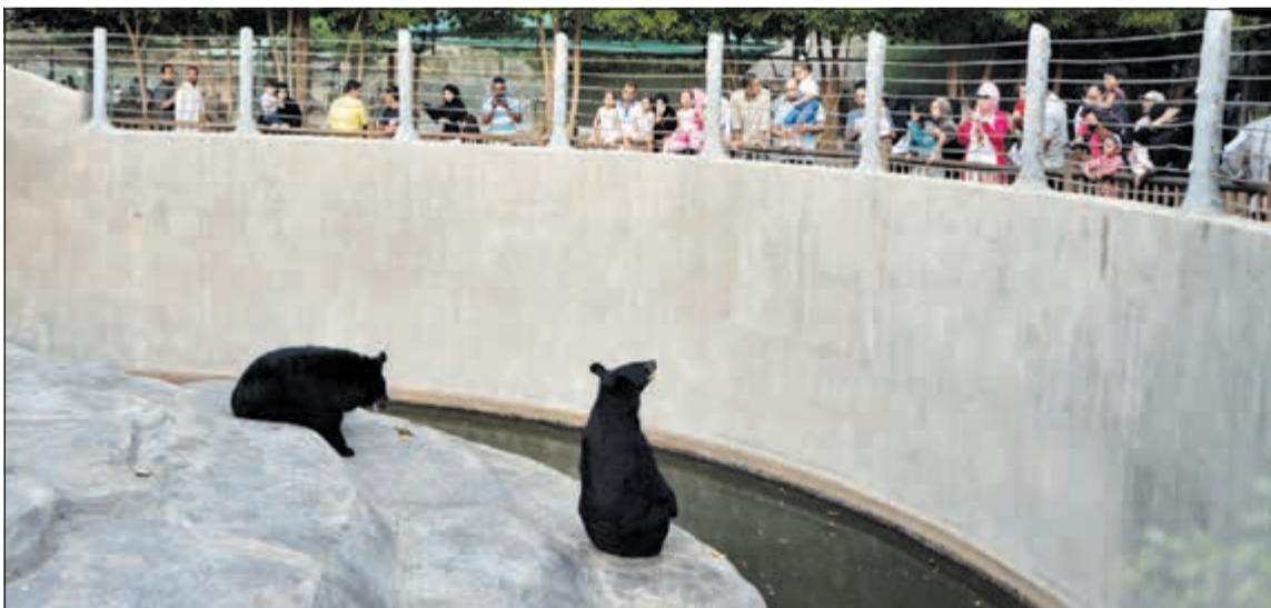
مشاهدة الحيوانات بالحديقة