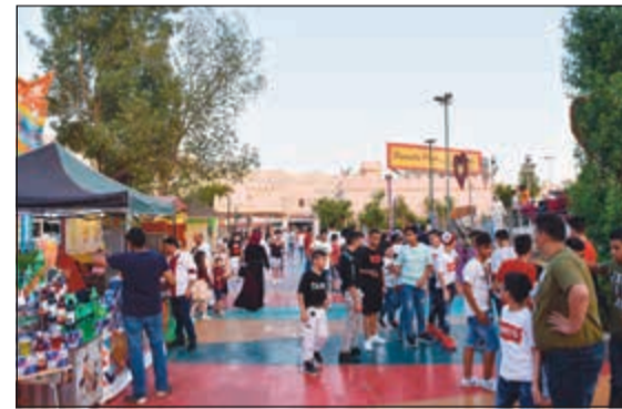
الشباب والصغار حريصون على الألعاب في اول النهار