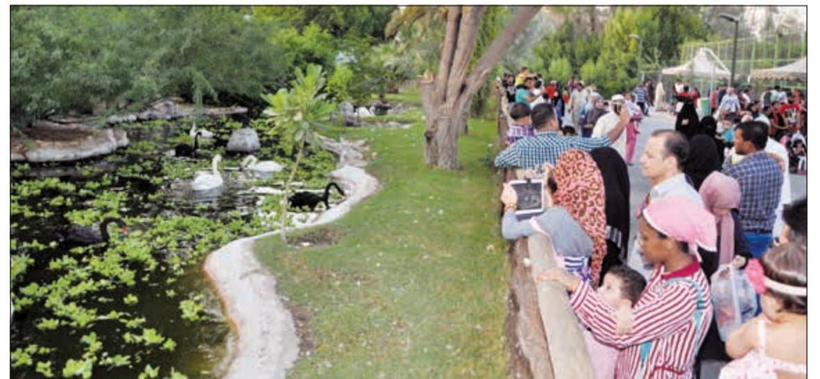
زحام في حديقة الحيوان