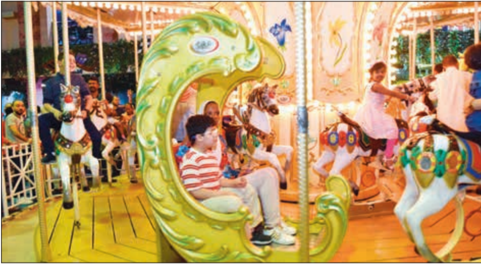
ألعاب مختلفة في العيد

مع حلول العيد في الكويت، تتعدد مظاهر الفرح والاحتفال به وتتنافس بين الصغار والكبار. لكن الألعاب والألعاب التي تجذب الأطفال في كل وقت وبصفة زائدة في العيد ويشاركهم في ذلك ذوقهم من الكبار الذين يحرصون على أن يستمتع أطفالهم بهذا المذاق المميز للعب في هذه المناسبة السعيدة، ويجدون في ذلك متعة خاصة لهم.