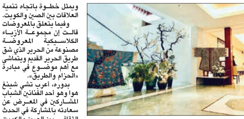
جانب من معروضات المعرض

ويمثل خطوة باتجاه تنمية العلاقات بين الصين والكويت. وفيما يتعلق بالمعروضات قالت إن مجموعة الأزياء الكلاسيكية المعروضة مصنوعة من الحرير الذي شق طريق الحرير القديم ويتماشى مع أهم موضوع في مبادرة «الحزام والطريق». بدوره، أعرب تشي شينغ هو وهو أحد الفنانين الشباب المشاركين في المعرض عن سعاداته بالمشاركة في الحدث الثقافي بين الصين والكويت مؤكداً أن الثقافة والفن يعتبران من الجسور المهمة في التواصل بين الشعوب. وضم المعرض العديد من الأعمال الفنية المعاصرة لسنة مايو و70 عاماً على تأسيس جمهورية الصين الشعبية و40 عاماً على تنفيذ سياسة الانفتاح والإصلاح بالإضافة إلى متابعة النتائج المثمرة التي حققتها زيارة الدولة لسمو الأمير الشيخ صباح الأحمد إلى الصين العام الماضي والتي توجت بانفاقيات عديدة مهمة وجوهرية بالنسبة للعلاقات الاستراتيجية والمتميزة القائمة بين الصين والكويت. وتميز المعرض بكسر حاجز المألوف في معارض الأزياء حيث جمع بين الأزياء الصينية التقليدية التراثية والأزياء الكويتية التقليدية القديمة التي تجسد خيوطها الحريرية تاريخاً طويلاً من الحضارات الممتدة لآلاف السنين ومنحوتات ولوحات فنية رائعة طبعتها أنامل مجموعة من الفنانين الشباب الصينيين.