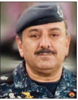
النواف شكري النجار

رسمياً، صدر مرسوماً بتعيينات قيادية، حمل الأول تعيين اللواء شكري النجار بدرجة وكيل وزارة مساعد في وزارة الداخلية. ونص المرسوم الثاني على تعيين شفيق أحمد السيد عمر بدرجة وكيل وزارة مساعد بمكتب وزير الدولة لشؤون الشباب لمدة 4 سنوات اعتباراً من 16 ديسمبر 2018.