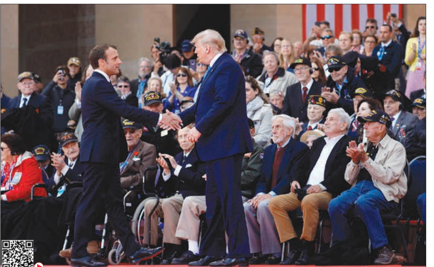
مصافحة بين الرئيسين الأميركي دونالد ترامب والفرنسي إيمانويل ماكرون خلال احياء فرنسا أمس الذكرى الـ 75 لإنزال «نورماندي»

واضاف خلال كلمة له امام مقبرة الجنود الأميركيين في «نورماندي» أن «الرابط بين الولايات المتحدة وحلفائها التي نسجت في أوج معركة الحرب العالمية الثانية لا يمكن كسرها». ووضعت رئيسة الوزراء