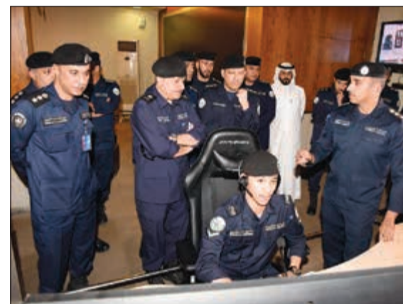
اللواء جمال الصايغ يتابع تحرير المخالفات عبر غرفة التحكم بالإدارة العامة للمرور

شهر رمضان تقدر اعدادهم بـ 50 رجلاً وامرأة، وان جميع من ضبطوا متسولون او مخالفون لقانون الإقامة تم ادراج اسمائهم على قوائم غير المصرح لهم بالدخول وجرى تبصيمهم في المطار، بحيث لا يستطيعون العودة مجدداً. ولقت المصدر التي ان غالبية المتسولين الذين تم ابعادهم من جنسيات عربية، فيما هناك اعداد من جنسيات آسيوية، موضحاً ان عدد من احيلوا الى ادارة الابعاد خلال شهر رمضان فقط هم 320 وافداً ووافدة منهم المتسولون، وهو ما يعني ان عدد المخالفين بلغ 270 وافداً ووافدة، وهؤلاء تم الانتهاء من اجراءات ابعادهم بنسبة تجاوزت الـ 98٪.