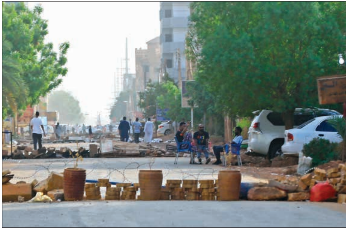
محتجون يغلطون الطرق وسط العاصمة الخرطوم لمنع مرور مركبات الجيش أمس (أ.ف.ب)

وكالات: قال الصادق المهدي، رئيس حزب الأمة السوداني أمس، إن المجلس العسكري لعب دورا مفصليا في الثورة السودانية وطالب الصادق المهدي في تصريحه نقلتها موقع قناة العربية، المجلس الانتقالي بحساسية المسؤولين عن فض ساحة الاعتصام، وانتقد طريقة فضه. ودعا قوى