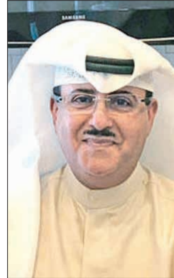
وكيل الإذاعة الشيخ فهد المبارك