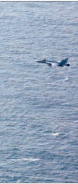
مقاتلات أميركية تحلق فوق بحر العرب بعد انطلاقها من على متن حاملة الطائرات أبراهام لنكولن مطلع الشهر الجاري

الرسمية التي بثت مباشرة عبر التلفزيون الرسمي «يا أمة البناء والتشييد نصون الأمانة ونحميها من المشاريع المغرضة بتطافر جهود الجميع.» ودعا بن عامر إلى المحافظة على سلمية المسيرات والحذر من اختراقها، قائلاً «نحن مطالبون بالحذر، شعارنا الانضباط وحفظ النظام والأمن لا اعتداء ولا اضرار وفساد في الأرض.» وألح بن عامر على أن الجزائر قادرة على الخروج أقوى من الأزمة السياسية التي تعيشها حالياً.