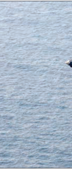
مقاتلات أميركية تحلق فوق بحر العرب بعد انطلاقها من على متن حاملة الطائرات أبراهام لنكولن مطلع الشهر الجاري

وأكد استعداده روسيا للمشاركة في اجتماع مع الأعضاء المتبقين في الاتفاق على مستوى وزاري وفي أي مكان وموعود يتم تحديده «وقد أعلننا قبل ذلك استعدادنا للمشاركة في اجتماع ينعقد في طهران أو في مكان آخر لكن الوقت قد حان لعقد اجتماع على مستوى القادة السياسيين لاتخاذ قرار حول الاتفاق (النووي)». وأشار إلى علاقات بلاده مع إيران، موضحاً: أننا في روسيا ملتزمون تماماً بهذه القضية. ونمة أدوات وآليات، مثل اللجان الحكومية، ومجموعات العمل، لتوطيد العلاقات الاقتصادية بين البلدين، بالإضافة إلى وجود آلية للاتفاف على إساءة أميركا لاستخدام الدولار وغيرها.