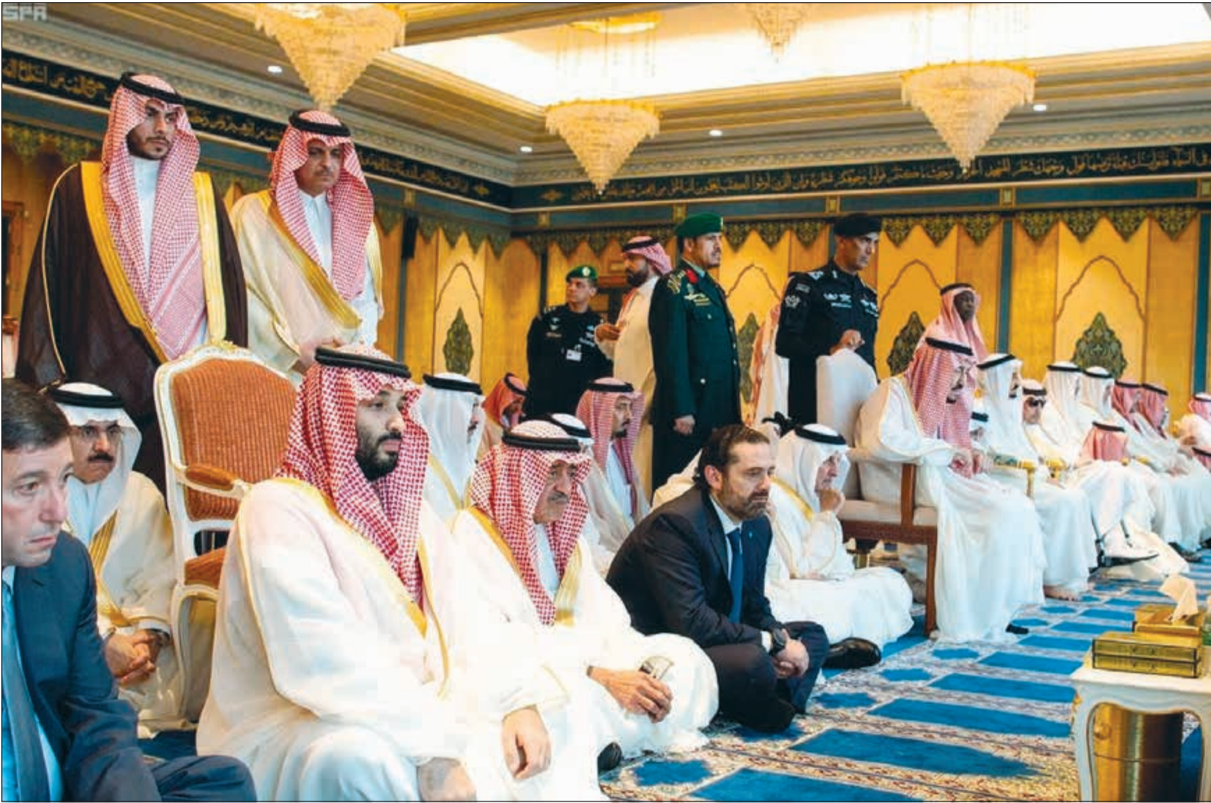
خادم الحرمين الملك سلمان بن عبدالعزيز وولي العهد صاحب السمو الملكي الامير محمد بن سلمان يؤديان صلاة عيد الفطر بمكة المكرمة أمس

المطور الرئيسي والمشغل المعنى بتهيئة ورفع الطاقة الاستيعابية للمشاعر المقدسة للاستخدام على مدار العام لخدمة الأعداد المتزايدة من ضيوف الرحمن. واستعرض مجلس إدارة الهيئة الملكية مقترح حوكمة إدارة المشاريع وأعمال التشغيل في المسجد الحرام، ومقترح حوكمة منظومة قطاع النقل والطرق في مكة المكرمة والمشاعر المقدسة، بالإضافة لمقترح إنشاء صناديق وقفية خاصة بمدينة مكة المكرمة. وأوضح الرئيس التنفيذي للهيئة الملكية لمدينة مكة المكرمة والمشاعر المقدسة عبدالرحمن بن فاروق عباس، أن القرارات والتوجيهات التي تم اعتمادها وإصدارها تأتي في إطار الاهتمام الكبير الذي توليه حكومة خادم الحرمين الشريفين لتسريع وتيرة تحقيق الأهداف التي تأسست من أجلها الهيئة الملكية لمدينة مكة المكرمة والمشاعر المقدسة بقيادة ولي العهد، والرامية إلى تأسيس مستقبل مستدام لمدينة مكة المكرمة والمشاعر المقدسة في حلقة متجددة ابتداء من المحافظة على روحانية المكان، وتقديم أفضل الخدمات لضيوف الرحمن وإثراء جودة الحياة في مدينة مكة المكرمة.