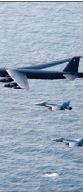
مقاتلات أميركية تحلق فوق بحر العرب بعد انطلاقها من على متن حاملة الطائرات أبراهام لنكولن مطلع الشهر الجاري

مستعدة للحوار مع إيران دون شروط مسبقة بشأن برنامجها النووي، لكنها تريد منها أن تتصرف «كدولة طبيعية» أولاً. وتساعدت حدة التوتر بين الجانبين خلال الأسابيع الماضية بعد عام من انسحاب الولايات المتحدة من اتفاق بين إيران والقوى العالمية للحد من برنامج طهران النووي مقابل رفع العقوبات.