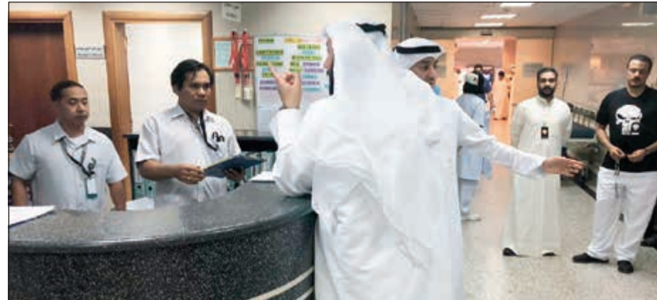
الوزير الشيخ د.باسل الصباح خلال جولته التفقدية في أقسام مستشفى الأميري

قام وزير الصحة الشيخ د.باسل الصباح بجولة تفقدية صباح أمس على مستشفى الأميري برفقة مدير المستشفى د.علي العلندة وفريق العلاقات العامة في المستشفى للوقوف على جاهزية قسم الحوادث والأجنحة المختلفة خلال عطلة عيد الفطر السعيد أعاده الله علينا باليمن والبركات. وخلال الجولة قام الشيخ د.باسل الصباح بزيارة المرضى معابدا إياهم، متمنيا لهم الشفاء العاجل ليحتفلوا بهذه المناسبة مع ذويهم وأحبائهم. كما قدم الشكر الجزيل للطواقم الطبي والإداري في المستشفى المخافرين خلال هذه العطلة بعيداً عن ذويهم لتلبية نداء الواجب وخدمة الوطن الحبيب.