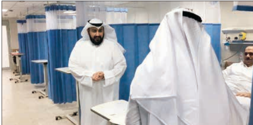
الشيخ د.باسل الصباح يطمئن على حالة أحد المرضى