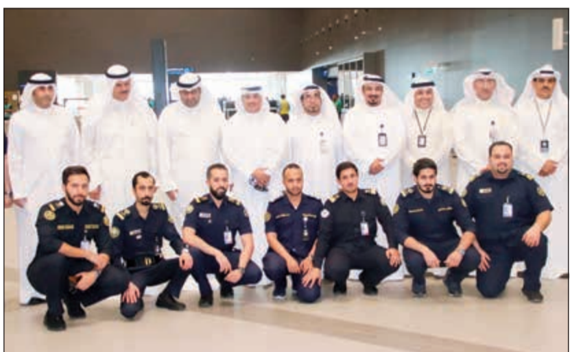
خالد الروضان والشيخ سلمان الحمود يتوسطان مجموعة من العاملين خلال جولة في مبنى الركاب 1 و4

على استعدادات القطاعات التشغيلية خلال عطلة عيد الفطر وموسم الصيف. وأشار الروضان إلى الأهمية البالغة التي توليها الدولة لقطاع الطيران المدني، لافتاً إلى أن مجال النقل الجوي يشهد مجموعة من المشاريع التطويرية لتحديث البنية التحتية للمطار لرفع كفاءته التشغيلية وتحسين الخدمات المقدمة.