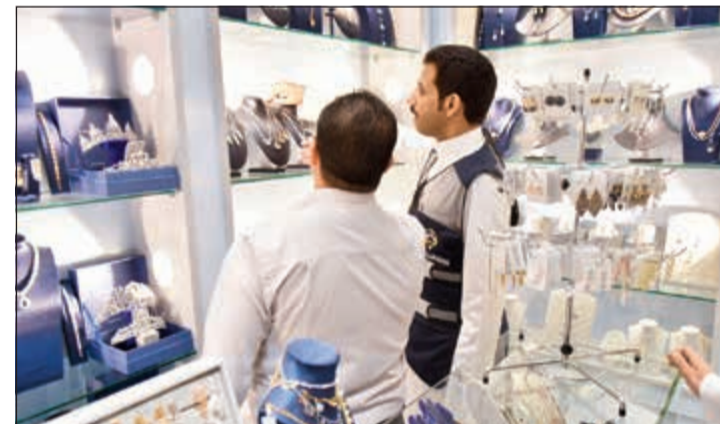
جانب من الجولة في أحد محلات الذهب والمجوهرات