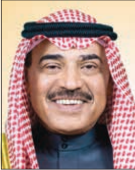
الشيخ صباح الخالد

القنصلية في فرانكفورت، مؤكدة ان الوزارة ستتابع التحقيقات حتى تتم معرفة سبب الوفاة فيما سيتم نقل جثمان الفقيدة بعد الانتهاء من الاجراءات مع السلطات الألمانية. واختتمت الإدارة تصريحها بالاعراب عن تعازيها ومواساتها لأسرة الفقيدة، متضرعة إلى الباري عز وجل أن يعفدها بواسع رحمته ويسكنها فسيح جناته.