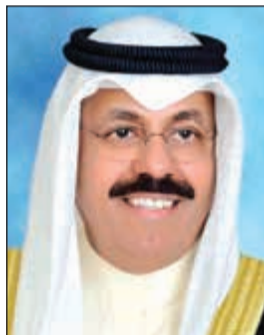
الشيخ احمد النواف

الجليلة وتمنياته بان يعيدها الله على الكويت وقيادتها الرشيدة وأهلها الأوفياء بالعزة والرخاء والأمن والأمان وعلى الأمتين العربية والإسلامية بالخير واليمن والبركات، مبتهلا إلى المولى عز وجل أن ينعم على صاحب السمو الأمير الصحة والعافية وطول العمر.