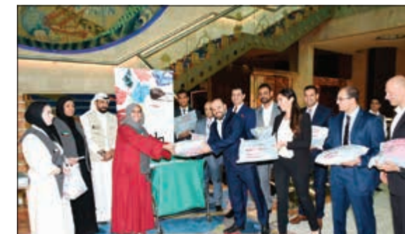
فريق عمل ملبوس العافية مع مسؤولي وموظفي الفندق

هذا المنطلق قمنا بالتعاون مع فندق كراون بلازا وهوليدي إن سيتي الكويت بحملة لصالح