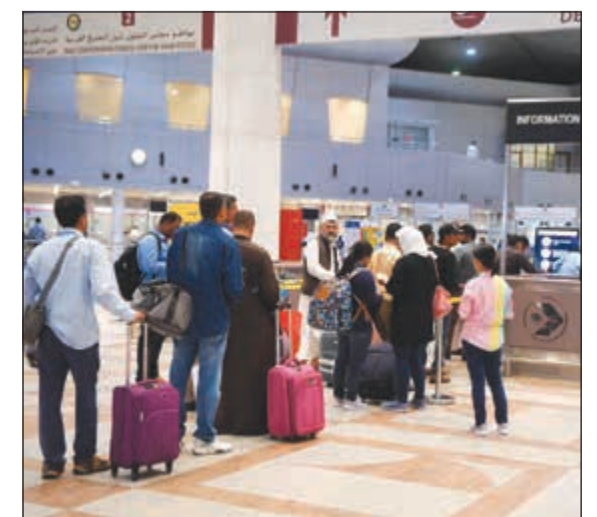
مسافرون لقضاء العيد

+965 23730047 / 8 / 9 +965 6038 5558 6042 6662 6036 6632 6007 3332 دولة الكويت - أبو ظبي - طريق فيصل السريع رقم 30 - قطرة 2 - 211 - 211 قطرة 2 Kuwait - Abu Halifa - Fahahel Highway - Exit 211 - Block 2 www.collegeofaviation.com collegeofaviation