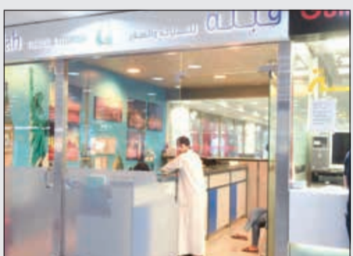
مكاتب السفريات بالمطار تسهل على المسافرين

أشار عدد من أصحاب مكاتب السفريات إلى ضرورة اختيار المسافرين لمكاتب السفر المعتمدة وعدم التعامل مع أي جهات من هذا النوع لا تكون موثوقة وحاصلة على اعتماد، وذلك حتى لا يكونوا فريسة لعمليات النصب والاحتيال والتي يتنا نسمع عنها كثيراً مؤخراً من حيث التلاعب بالمسافرين والغش في التذاكر. وأكدوا على أنه يجب على المسافر عند الحجز أن يحرص على الحصول على وصل وكذلك على رقم الحجز المؤكد لتذكرته حتى يتجنب أي مشكلات أو أخطاء في الحجز.