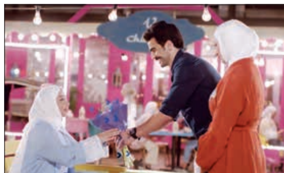
رسائل إيجابية في «انشر أمل»