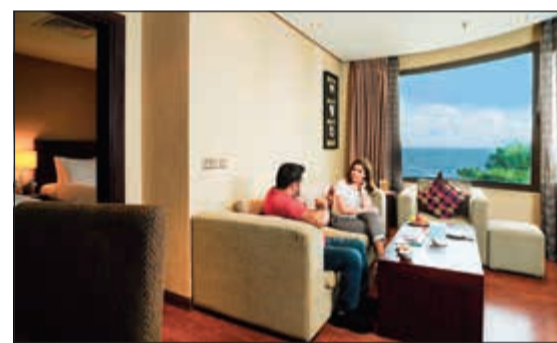
إقامة فريدة لجميع المستويات