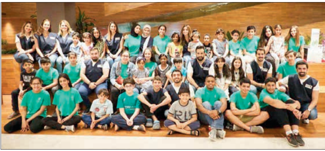
فريق «الوطني» و«لويك» في صورة جماعية مع الأطفال