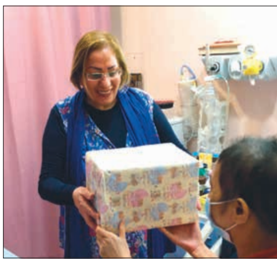
توزيع الهدايا على المرضى