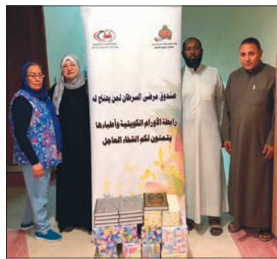
متطوعو صندوق مرضى السرطان خلال زيارتهم لمركز مكي جمعة

على أهمية إعلام الناس بعوامل المخاطرة المسببة للسرطان وتعريفهم بأهمية الكشف المبكر، لافتاً إلى أن نسبة الشفاء من أمراض السرطان عالمياً تتراوح بين 60 و70٪، ويمكن بالتوعية أن تصل بها بين 80 و85٪، حسبما أوصت منظمة الصحة العالمية، مشدداً على أن مرض السرطان لم يعد قاتلاً، لافتاً إلى أن الأطباء لاحظوا أن المرضى الذين يعالج في الكويت تكون لديه نسبة شفاء ودعم ومساندة روحية وأسرية ومجتمعية أفضل ممن يعالجون في الخارج.