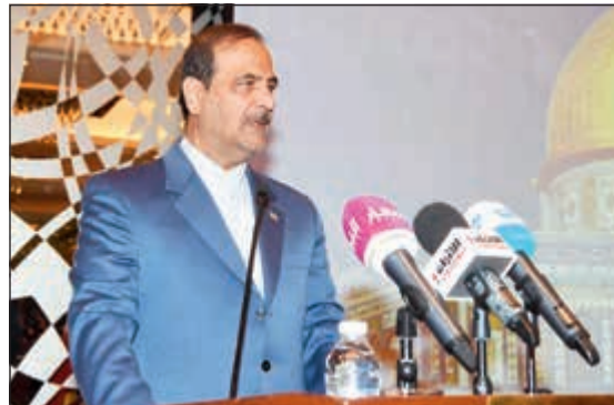
السفير محمد إيراني يلقي كلمته