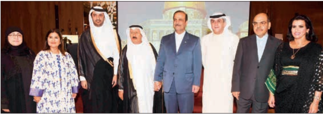
السفير القطري بندر بن عطية وجواد بوخمسين وعباس تقي وفاطمة العازمي ونبيلة العنجري يهتفون

لم نقدم مقترح اتفاقية عدم الاعتداء للكويت بشكل رسمي ولكننا طرحناه وفي انتظار الرد ونحرص على الحوار وتجنب التصعيد