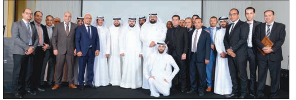
لحظة تذكارية لموظفي الشركة مع بعض المدعوين