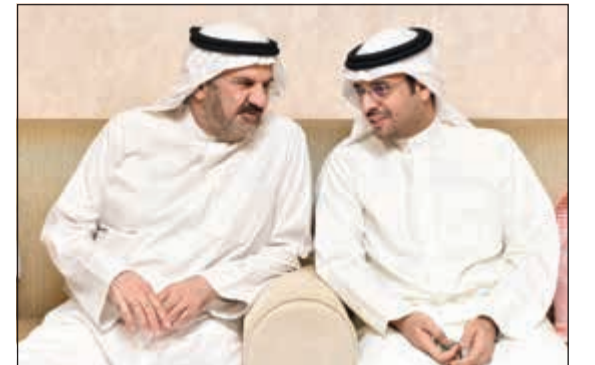
محافظ الجهراء ناصر الحجرف مهنتا الفريق م. عبدالعزيز الرئيس

أكد خلال غبة أقامتها السفارة رفض اتهام بلاده بزعة أمن المنطقة والتدخل في شؤون دولها