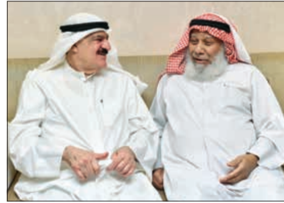
حمد العميري مهنتا أحمد الرئيس بسلامة العودة

وتقدمت عائلة الرئيس بجزيل الشكر والتقدير لكل من حضر ولكل من اتصل ولمن لم يسعفه الوقت للحضور، سائلين الله العلي القدير أن يحفظ الجميع من كل مكروه.