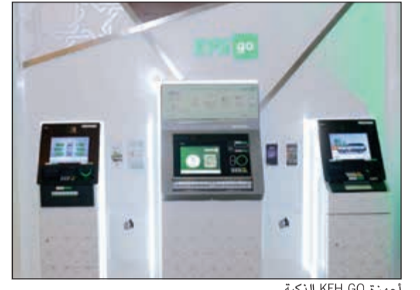
أجهزة KFH GO الذكية