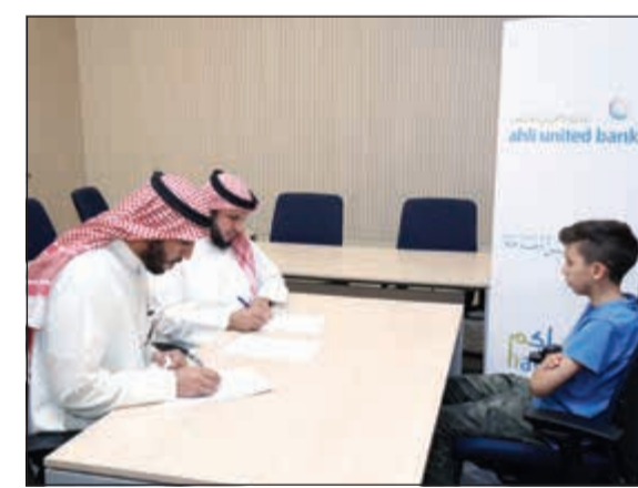
أحد الأطفال يشارك في مسابقة القرآن الكريم