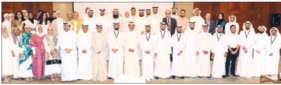
الخرافي والقراشي والمطر يتوسطان المتطوعين والمتطوعات خلال الحفل السنوي