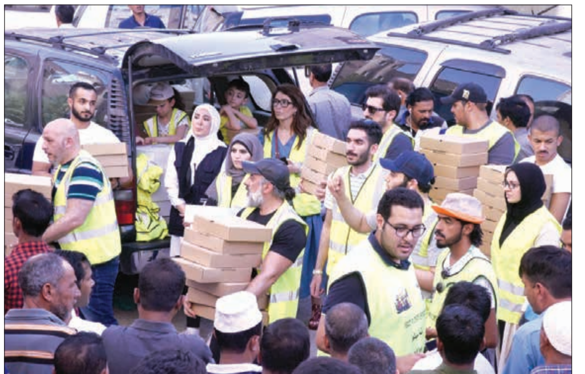
فريق «المتحد» التطوعي يوزعون المجلة