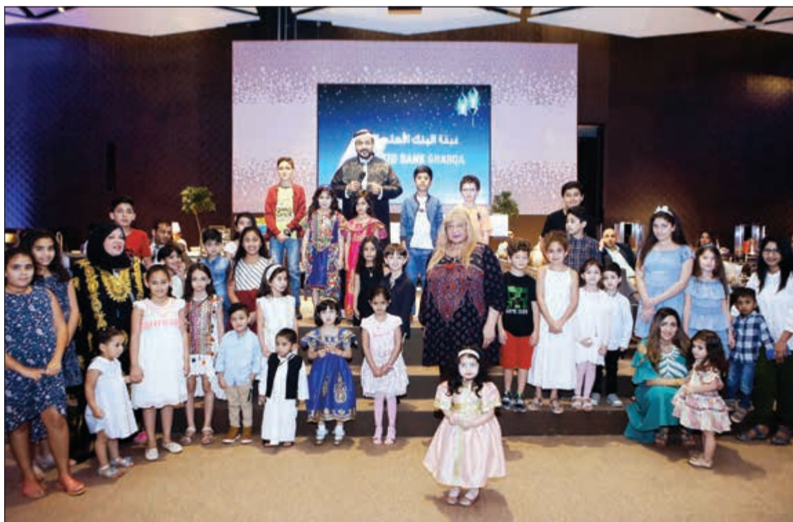
فرحة أطفال الموظفين بالغفبة الرمضانية

القرآن الكريم للعام الخامس على التوالي، وشملت ثمانية فئات من المتسابقين كالاتي: فئتا الموظفين ذكورا وإناثا وكان الاختبار في سورة (الصف)، وفئة الأطفال من أبناء الموظفين والموظفات للمرحلة العمرية ما بين 5 و14 عاماً، وكان الاختبار في سورة (الفجر) وأبناء الموظفين والموظفات للمرحلة العمرية ما بين 14 و18 عاماً وكان الاختبار في سورة (نوح). وشملت المسابقة فئة عامة من الأطفال الذين تتراوح أعمارهم بين 5 و12 عاماً وكانت المنافسة في الجزء