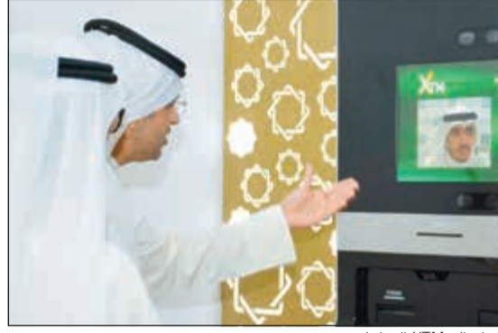
جهاز الـ XTM التفاعلي

XTM التفاعلية، والفروع الذكية KFH Go في جمعيات اشبيلية والجابرية، بالإضافة إلى سيارات موبي «بيتك» التي تنتشر بمواقع مختلفة في الكويت لتلبية متطلبات جميع العملاء حينما وجدا. وأضاف أن الفروع التي توفر الخدمة على مدار الساعة هي: القصر، عبدالله