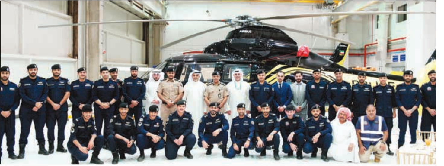
لقطة لأسرة البنك التجاري مع رجال جناح طيران الشرطة

ضمن برنامج الرمضان المميز الهادف إلى مشاركة كل قطاعات المجتمع الأجواء الرمضانية خلال الشهر الفضيل، قام البنك التجاري الكويتي بتنظيم زيارة إلى رجال جناح طيران الشرطة في قاعدة الشيخ نواف الأحمد الجوية - التابعة لوزارة الداخلية لمشاركتهم مأدبة الإفطار في هذا الشهر الفضيل، وذلك تقديراً لدور