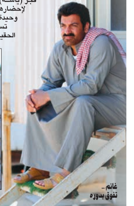
غانم.. تفوق بدوره

يستعد لمشاركة فيفي عبده بطولة «بناتوة الجليعة» في عيد الفطر