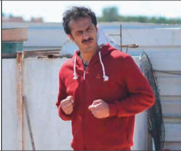
عادل.. النجم الأبرز تمثيليا في العمل