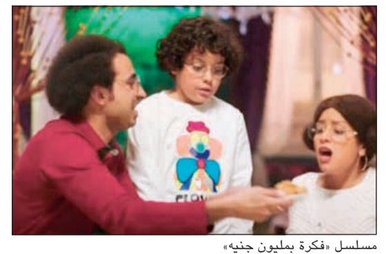
مسلسل «فكرة بمليون غيب»

وصلنا الى الاسبوع الاخير من شهر رمضان المبارك ومسلسل «فكرة بمليون غيب» لا حس ولا خبر، ويبدو أنه تاه وسط الأعمال الكثيرة المعروضة، والظاهر أنه ما عجب الجمهور اللي في بداية رمضان كان يسأل «فكرته شنو؟!».