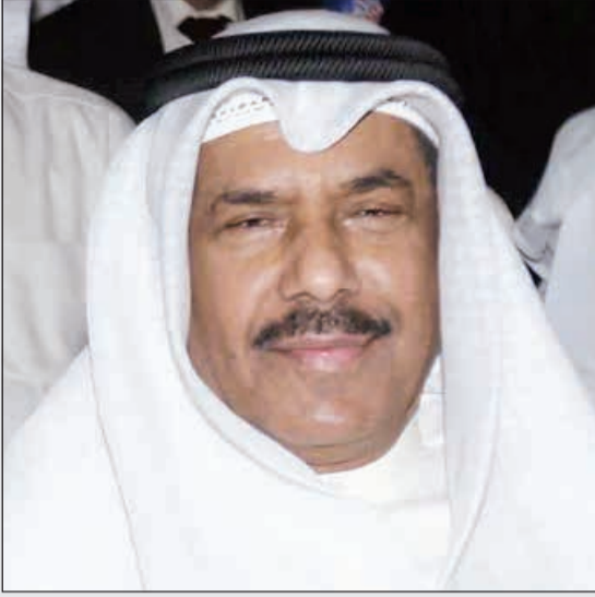
الموسيقار غنام الديكان