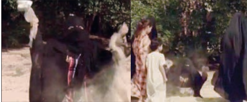
مشهد وضحة في المسلسل