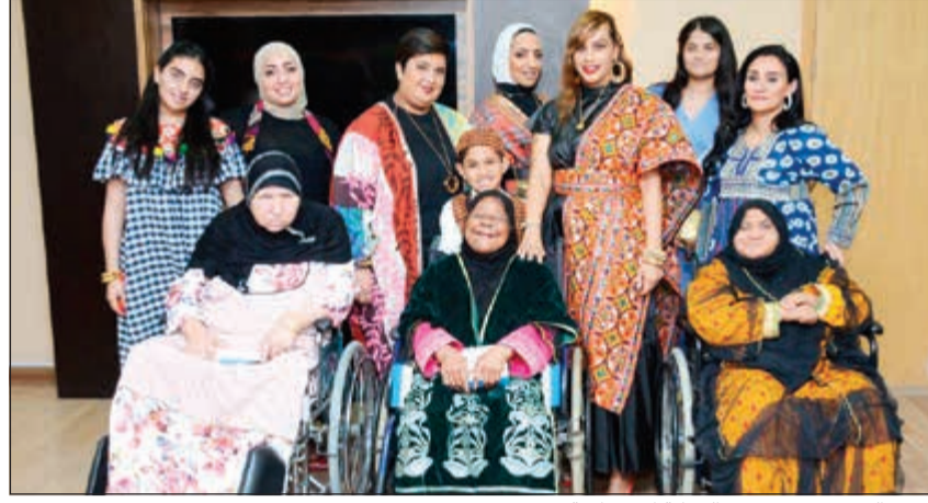
فريق البنك مع نزلاء دور الرعاية الاجتماعية

اختتم بنك برقان، أحد المساهمين الرئيسيين في تقديم المجتمع، زيارته السنوية بمناسبة القرقيعان لنزلاء دور الرعاية التابعة لوزارة الشؤون الاجتماعية وذلك في إطار مبادراته الاجتماعية واستراتيجيته الهادفة إلى دعم كافة المؤسسات الفعالة في هذا المجال.