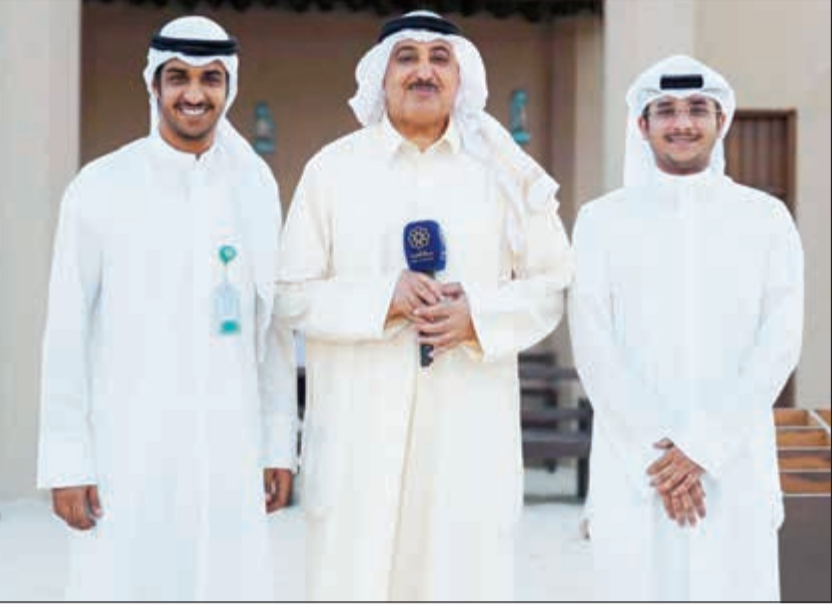
موظف «بيتك» مع مقدم برنامج «مدفع الإفطار»

عملاء متميزة. ويدر «بيتك» عملياته في دول مجلس التعاون الخليجي وآسيا وأوروبا من خلال أكثر من 504 فرع بما في ذلك بيت التمويل الكويتي - التركي (بيتك) لتقديم خدمات البنك للعملاء في تركيا والسعودية والبحرين وماليزيا وألمانيا والإمارات. وتتمثل رسالة «بيتك» في تحقيق أعلى مستويات العملاء والتميز في خدمة المصلحة المشتركة لجميع الأطراف المعنية بالمؤسسة المالية.