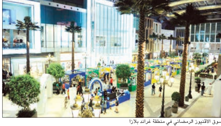
سوق الأقنيون الرمضاني في منطقة غراند بلازا

الاستمراراً لحرص إدارة «الأقنيون» على إقامة المعارض والفعاليات المختلفة لتقديم تجربة تسوق مميزة، ونظراً لنجاح الذي حققه العام الماضي، انطلق «سوق الأقنيون الرمضاني» للمستنة الثانية على التوالي في منطقة غراند بلازا في «الأقنيون»، وذلك اتساقاً مع أجواء الشهر المبارك. واستهدف السوق توفير وتسويق المنتجات الرمضانية كالتمور، البطور، البخور، الحلويات والهدايا الرمضانية وغيرها تحت سقف واحد، وذلك ليتمتع الزوار بتجربة تسوق إضافية مختلفة، حيث تميز السوق الرمضاني بطابع الأسواق التراثية في المدن العربية والتي تتميز بالتنوع الجميل وتحاكي أجواء الشهر الفضيل، وذلك بمشاركة أكثر من 27 محلاً لبيع المستلزمات من المحلات المتخصصة في العطور مثل أطياب المرشود، أطياب الشيخ، أمل الكويت، كنوز الطبيب، عالية تاتش،