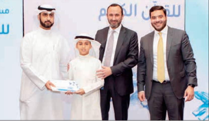
تكريم أحد الفائزين في المسابقة

العقاري الكويتي، ومن ثم تحول إلى بنك إسلامي عام 2007، ويمارس البنك عملياته المصرفية من خلال شبكة فروع منتشرة في جميع أرجاء الكويت، كما يقدم مجموعة متنوعة وشاملة من المنتجات والخدمات والحلول المصرفية المتوافقة مع أحكام الشريعة الإسلامية، وانسجاماً مع رؤية ورسالة البنك، ويمتلك «KIB» برنامجاً رائداً في مجال المسؤولية الاجتماعية يهدف إلى دعم جميع أفراد المجتمع الكويتي من خلال عدد كبير من المبادرات والنشاطات.