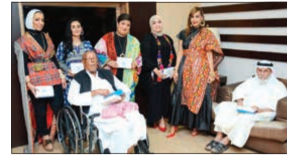
توزيع الهدايا على النزلاء

وتأتي هذه الزيارة السنوية ضمن أهداف بنك برقان الاستراتيجية للمسؤولية الاجتماعية كما يعكس حرصه منذ إنطلاقه على تنظيم أنشطة اجتماعية تهدف إلى المساهمة بدعم مختلف شرائح المجتمع. كما يحرص البنك دائماً على مشاركة موظفيه في هذه المبادرات الإنسانية خصوصاً في شهر رمضان المبارك كونها تصبف البهجة والسعادة على وجوه النزلاء وتغرس في الموظفين قيماً جميلة مثل العطاء والتراحم والتواصل مع باقي فئات المجتمع. وتندرج هذه المبادرة ضمن