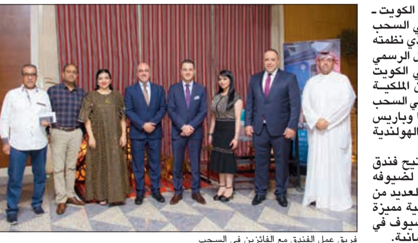
فريق عمل الفندق مع الفائزين في السحب

أعلن فندق هوليداي إن الكويت - السالمية عن أسماء الراحين في السحب الرمضاني الأسبوعي الأول والذي نظّمته إدارة الفندق بالتعاون مع الممثل الرسمي لوزارة التجارة والصناعة في الكويت والممثلين الرسميين لطيران الملكية الهولندية، وقد تسلم الراحين في السحب تذكار سفر لاسترداد وفيينا وباريس برعاية شركة طيران الملكية الهولندية وبرعاية بنك الكويت الدولي. ومع تقي سحب واحد، يتيح فندق هوليداي إن الكويت - السالمية لضيوفه فرصة دخول السحب على العديد من تذاكر السفر لوجهات أوروبية مميزة مقابل كل 10 دقائق ينقضي الضيوف في مطاعم الفندق والخيمة الرمضانية.