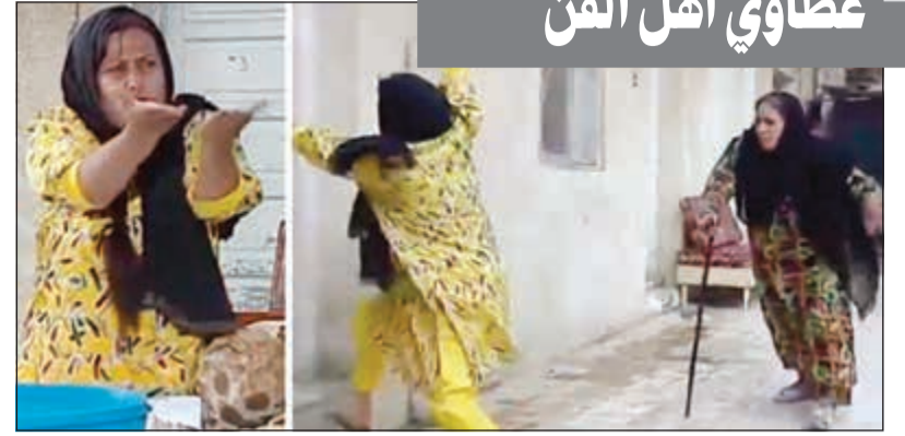
مشهد من مسلسل «سليمان الطيب»