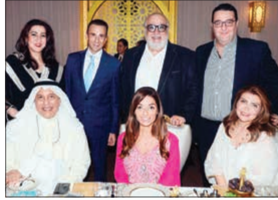
الشيخ مبارك فهد السالم وعدد من الحضور