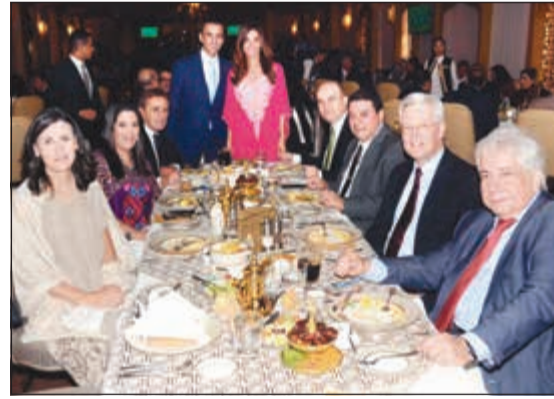
السفير الألماني كارل فريد بيرغر وعدد من الحضور