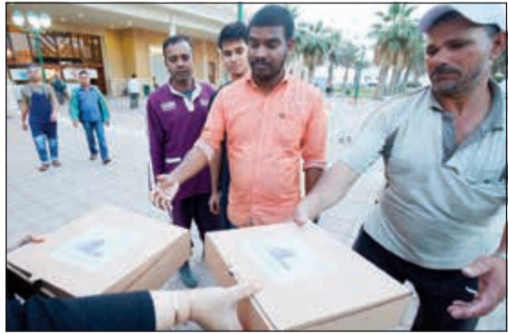
توزيع وجبات الإفطار