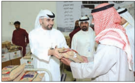
أثناء توزيع صناديق المواد التموينية

قام البنك الأهلي الكويتي بتوزيع صناديق المواد الغذائية بالتعاون مع جمعية الهلال الأحمر الكويتي لمساعدة الأسر المحتاجة خلال شهر رمضان المبارك. وتشتمل هذه الصناديق على المواد التموينية والغذائية الأساسية للأسر المتعققة بالكويت. ويعتز البنك بتعاونه مع جمعية الهلال الأحمر الكويتي، والمشاركة بالعديد من المساهمات الخيرية داخل الكويت وخارجها وهي تغطي العديد من المناطق المنكوبة ومناطق الكوارث على مستوى العالم. كما تعاون البنك مع لجان الزكاة في بعض المناطق السكنية بالكويت من خلال تقديم مجموعة من صناديق المعونات الغذائية التي تم توزيعها بمعرفة تلك اللجان على الأسر المحتاجة في المناطق التابعة لها.