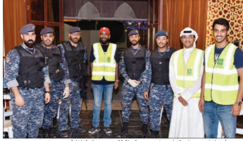
عدد من أعضاء فريق «بيتك» التطوعي في مسجد الدولة الكبير مع رجال الداخلية

يواصل فريق بيتك التطوعي جهودته في مسجد الدولة الكبير وعدد من المساجد في مختلف المحافظات لتقديم خدمة الضيافة والمشاركة في تنظيم صلاة القيام في العشر الأواخر من شهر رمضان المبارك.