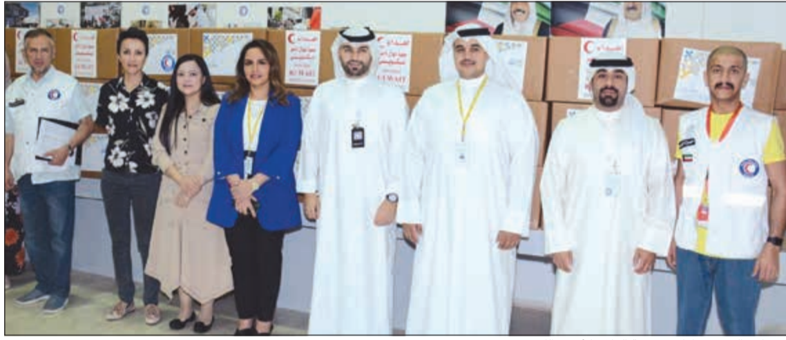
موظفو البنك مع إدارة جمعية الهلال الأحمر الكويتي