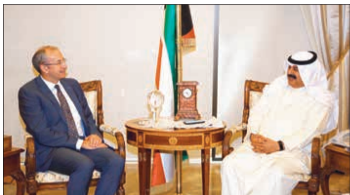
خالد الجارالله مستقبلاً السفير البريطاني

اجتمع نائب وزير الخارجية خالد الجارالله مع سفير المملكة المتحدة لدى الكويت مايكل دافنبورت إذ تم خلال اللقاء بحث عدد من أوجه العلاقات الثنائية بين البلدين إضافة إلى تطورات الأوضاع على الساحتين الإقليمية والدولية. ويأتي هذا الاجتماع في إطار الاستعدادات الجارية لعقد الدورة الـ 14 لمجموعة التوجيه المشتركة الكويتية - البريطانية التي ستعقد في لندن بداية شهر يوليو المقبل. وحضر اللقاء مساعد وزير الخارجية لشؤون مكتب نائب الوزير السفير أيهم العمر.