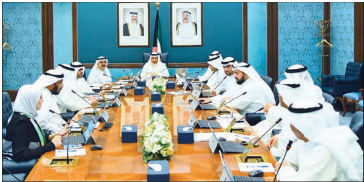
سمو الشيخ جابر المبارك مقرئاً اجتماع مجلس الوزراء

أكد مصدر مسؤول بوزارة الأشغال أن الوزارة طالبت وزارة المالية بتزويدها بميزانية إضافية لتغطية مشاريعها المنفذة والمتأخرة والبالغ عددها أكثر من 47 مشروعاً. وأضاف المصدر أن ميزانية وزارة الأشغال الحالية والتي تم رصدتها والبالغة نحو 500 مليون دينار لا تكفي