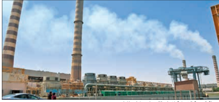
محطة الدوحة الشرقية لإنتاج الكهرباء وتقطير المياه

الصيانة المختلفة العاملة في المحطة. وأشار إلى أن المحطة تعد من أولى المحطات التي تم انشاؤها في تاريخ الكويت الحديث وتقع في منطقة الدوحة على الشاطئ الشمالي للكويت داخل جون الكويت وتضم مجموعة وحدات بخارية لتوليد الطاقة الكهربائية تم بناؤها على مرحلتين، الأولى منها شملت تشغيل أربع وحدات قدرة الوحدة منها 150 ميغاواط خلال الفترة من إبريل 1977 حتى يونيو 1978، والثانية شملت تشغيل ثلاث وحدات مماثلة بعد أعمال التوسعة التي تمت في المحطة من ديسمبر 1978 إلى يوليو 1979 حيث أصبحت الطاقة