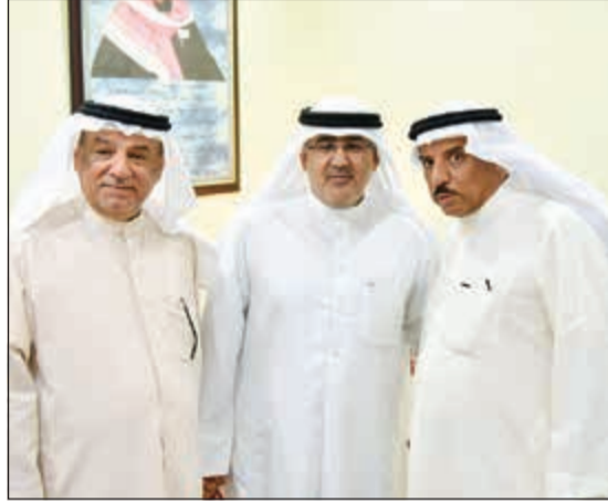
السفير سالم الخالدي مهنتا