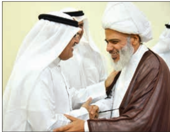
وعلي الجدي مهنتا

للمواطنين والتعاون فيما بينهما لتفادي أي مشكلات أو إشكالات اقتصادية أو سياسية أو اجتماعية يمكن أن تطرأ بسبب الظروف