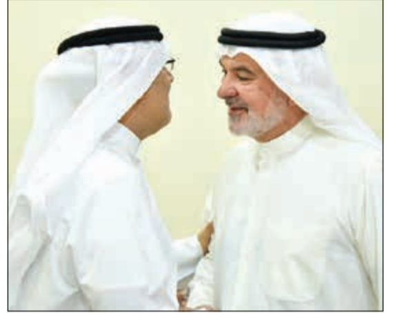
النائب صالح عاشور