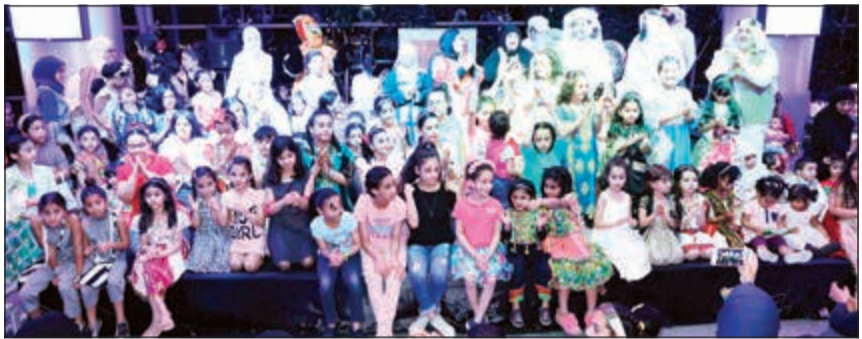
جانب من حفل القرقيعان

الأطفال في ازدياد مستمر وخصوصا في الكويت، وشكر كل من ساهم ودعم الاحتفالية وهم بيت التمويل الكويتي و«عطاء هب» وشركة «فانتازي وورلد».