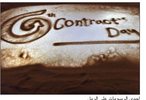
إحدى الرسومات على الرمل