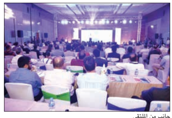
جانب من الملتقى

من خلال رؤية ثابتة وقيادة قوية والتزام تام بعملها وموظفيها، نظمت شركة عربي، إحدى الشركات الرائدة في المنطقة مؤخرا، الملتقى السنوي السادس للمقاولين برعاية ثلاث من الشركات العالمية، التي تمثلها شركة عربي داخل الكويت، وهي: كرين البريطانية للمحاسبين المستخدمة في شبكات التغذية والتكيف داخل المبانى، شركة برادفورد- وايت الأمريكية المتخصصة في السخانات المركزية، وشركة تيروليت النمساوية لمعدات قص الخرسانة ولوازم البناء. وهو حفل سنوي تحرص الشركة على تنظيمه لتقديم الشكر للعملاء الذين تعتبرهم الشركة عاملا