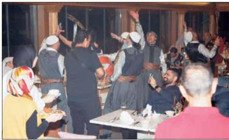
جانب من العزضة الشامية