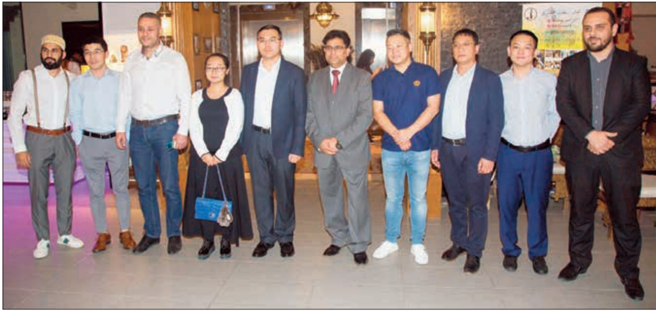
لقطة جماعية مع الحضور