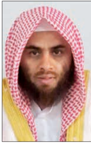
الشيخ عبدالرحمن السماوي