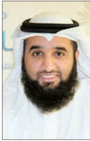
الداعية حسين العنزي