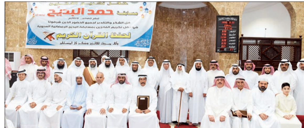
لقطة تذكارية خلال تكريم الفائزين بمسابقة حمد البديح السنوية لحفظ القرآن الكريم