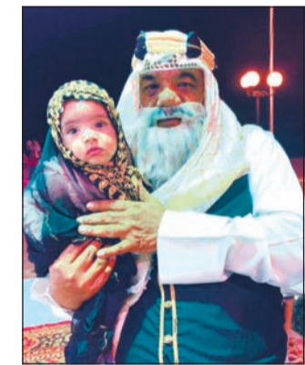
أبو طيلة وطفلة بالزي الشعبي