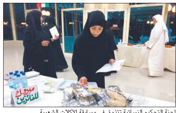
لجنة التحكيم النسائية تتدقق في مسابقة الأكلات الشعبية