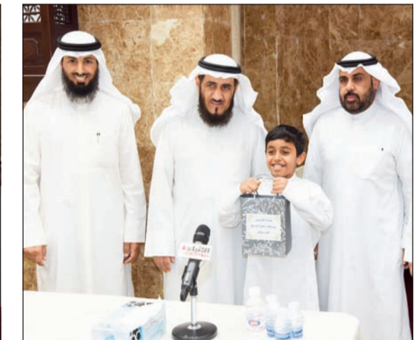
متسابق يتسلم هديته