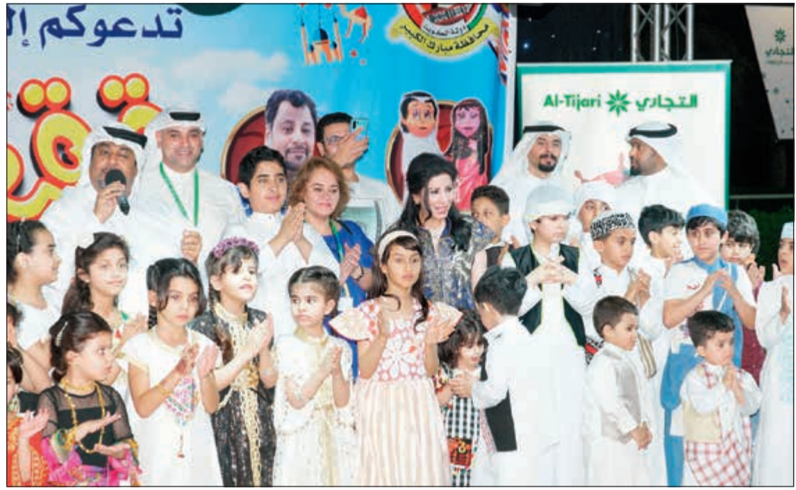
جانب من احتفالية محافظة مبارك الكبير بالقرقيعان

مبارك الكبير حيث أمضوا أمسية ممتعة ساهمت في إدخال الفرحة ورسم البسمة على وجوه الكبار والصغار. وفي ختام الحفل، قامت قيادات محافظة مبارك الكبير بتوجيه الشكر إلى البنك التجاري الكويتي عن رعايته للجنة الفالانة على التوالي للمناسبة المميزة التي تساهم في رسم الابتسامة على وجوه الأطفال وإدخال السعادة إلى قلوبهم.