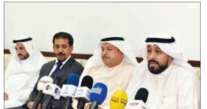
عرض مطالب الأطباء خلال المؤتمر الصحافي

الأحمد للكلية والمسالك د. دليم ورفعها إلى الجهات العليا والمعنية، مشددين على أن جميع الخيارات مطروحة أمامهم ومن بينها الاستقالة أو حتى اللجوء إلى المحاكم للحصول على حقوقهم في هذه الأزمة التي تحولت فيها وزارة الصحة إلى خصم. وقال المجتمعون من الأطباء في بيان بعد الثالث لأغلبية الأطباء الاستشاريين القائمين على مراكز التدريب والإشراف في البورد الكويتي ورؤساء الوحدات في جراحة الكلى والمسالك، وهي عنهم اختصاصي أول الكلى والمسالك في مركز صباح