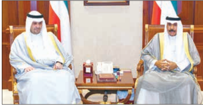
سمو ولي العهد الشيخ نواف الأحمد مستقبلا أنس الصالح