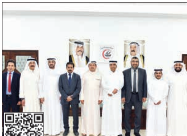
عدد من أطباء الكلى والمسالك البولية المشاركين في المؤتمر الصحافي (محمد هندواي)