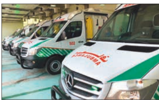
عدد من السيارات الجديدة

أعلن مدير إدارة الطوارئ الطبية في وزارة الصحة منذر الجلاهمة عن دشنت 79 سيارة إسعاف جديدة، كاشفا في الوقت نفسه عن الاستعداد للعمل على إدخال نفس العدد تقريبا إلى الخدمة خلال وقت قريب.