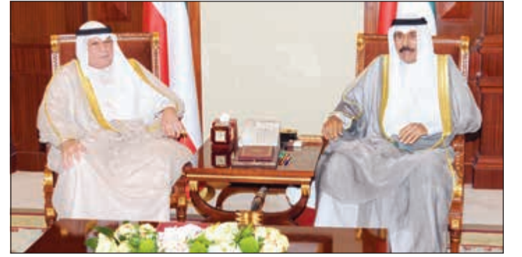
سمو ولي العهد الشيخ نواف الأحمد مستقبلا الشيخ خالد الجراح

استقبل سمو ولي العهد الشيخ نواف الأحمد مستقبلا أنس الصالح، كما استقبل سموه نائب رئيس مجلس الوزراء ووزير الداخلية الشيخ خالد الجراح. كما استقبل سموه نائب رئيس مجلس الوزراء ووزير الخارجية الشيخ صباح الخالد.