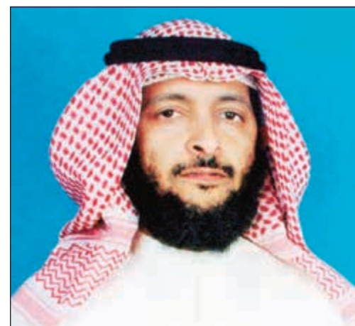
الشيخ يوسف السويلم

يقول الداعية يوسف السويلم: في رحلتي الى كينيا ذهبتا الى ممباسا ومنها الى جزيرة تنبوع عنها ساعتين في القارب السريع وأربع ساعات في القارب البطيء، ولما وصلنا الى هذه الجزيرة التي