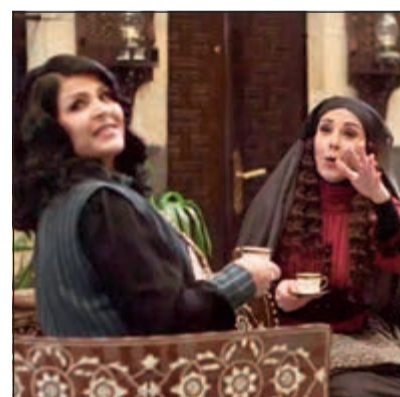
مشهد من مسلسل «سلاسل ذهب»

دخل مسلسل «سلاسل ذهب» هذا الموسم سباق المسلسلات السورية التي تتناول البيئة الشامية، لكنه لم يستطع ان يخرج من عباءة مسلسل «باب الحارة» الذي حقق نجاحا كبيرا، حيث تم نشر