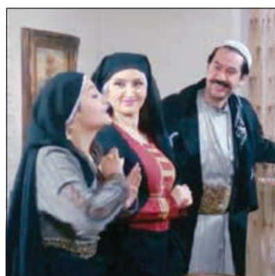
مشهد من «باب الحارة»

دخل مسلسل «سلاسل ذهب» هذا الموسم سباق المسلسلات السورية التي تتناول البيئة الشامية، لكنه لم يستطع ان يخرج من عباءة مسلسل «باب الحارة» الذي حقق نجاحا كبيرا، حيث تم نشر