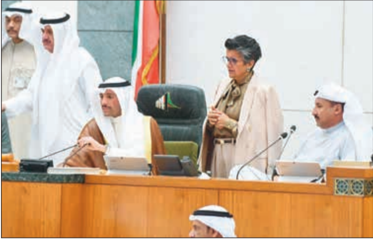
الرئيس الغانم وسعد الخنفور وصفاء الهاشم وعيسى الكندري (هاني الشمري)