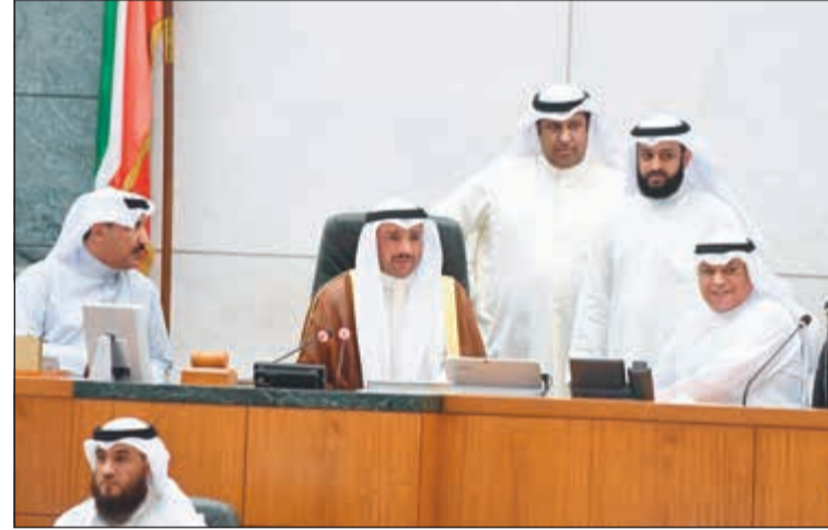
رئيس مجلس الأمة مرزوق الغانم والشيخ خالد الجراح وعبدالله فهاد والحيمدي السبيعي وسعد الخنفور

جديدة هو توجه مجلس الوزراء وليس مجلس الأمة، ونحن على العكس انشأنا هيئات جديدة طالما لها عمل وعمل مفعّل.