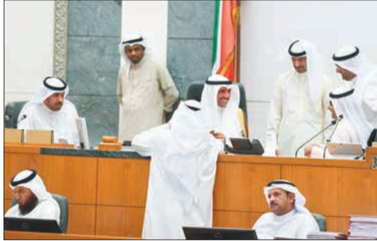
الرئيس الغانم ورياض العبدساني ودنايف الجحرف وعبدالرواب الباطين وعلي الدقباسي