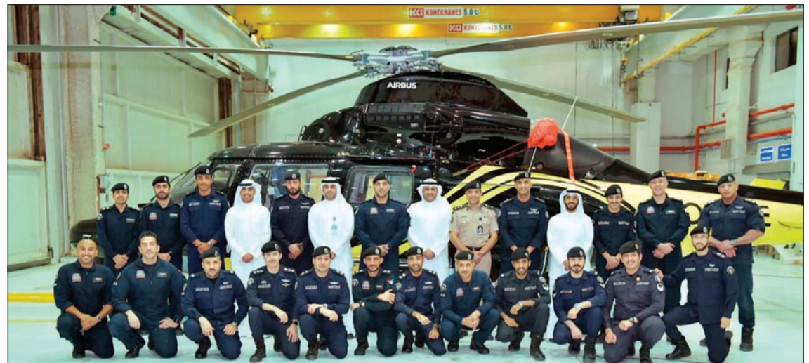
وفد «بيتك» يتوسط العاملين والمسؤولين بمركز الطيران العمودي

الأوقات التي يفضل فيها الجميع ان يكونوا بين أهلهم وأسرهم خاصة في شهر رمضان المبارك، ومن أهمها ساعة الإفطار التي يقضيها هؤلاء الرجال وهم على أهبة الاستعداد وفي منتهى البهجة، لآداء دورهم الداعم والمساند لأعمال الأجهزة الأخرى في حالات الطوارئ والإنقاذ وغيرها. وفي أجواء أخوية، تناول وفد «بيتك» مع العاملين والمسؤولين في مركز الطيران العمودي طعام الإفطار في رسالة عبرت عن الامتنان والاهتمام والتقدير لدورهم والتأكيد على الشكر لما يقومون به وما يتحملونه من أعباء ومشاق لضمان سلامة وأمان وراحة الجميع، حيث أشاد الفريق كذلك بالروح العالية التي لمساها في العاملين بالمركز واستعدادهم الكبير وجاهزيتهم العالية للتعامل مع أي طارئ في جميع