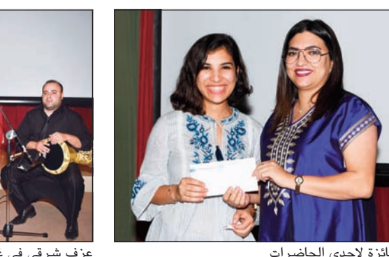
جائزة لإحدى الحاضرات

ومن أبرز فعاليات الأوسمة، السحب على الجوائز بناء على