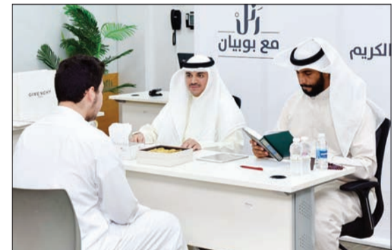
أحد المشاركين أثناء التسميع

الأكبر خلال الشهر الفضيل. وتتضمن شرائح المسابقة 3 شرائح الأولى من سن 7 إلى 9 سنوات والمطلوب حفظ حزب كامل «اختياري» والشريحة الثانية من سن 10-13 سنة والمطلوب حفظ جزء كامل (اختياري) والشريحة الثالثة من سن 14-17 والمطلوب حفظ جزأين كاملين «اختياري». وبالنسبة للجوائز فقد تم تخصيص 5 جوائز لكل شريحة ليصل الإجمالي إلى 30 جائزة للشرائح الثلاث، 15 جائزة لكل جنس، وهو ما يرفع عدد الفائزين تقديراً من إدارة البنك لحفظة كتاب الله. وخصصت الأيام الثلاثة الماضية للشباب بينما سيتم تخصيص الأيام من الثلاثاء إلى الخميس للفتيات من سن 7 إلى 17 عاماً.