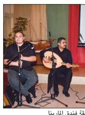
عزف شرقي في غبة فندق المارينا

وجاءت الأوسمة إحياء للتقاليد العريقة لهذه المناسبة عبر موائد البوفيه المتنوعة والعامرة بأشهى الأطباق العربية وغيرها من منصات الطهي الحية. وتضمنت الغبة الخاصة تشكيلة واسعة من المأكولات والمشروبات والحلويات بتكديتها المتنوعة، وكانت بذلك وجهة مثالية لهذه الليلة المهمة في الشهر الفضيل. وجاءت أنغام الموسيقى الشرقية الساحرة لتضفي لقا متميزاً على الأوسمة، فضلاً عن الأنشطة والمسابقات المتنوعة التي شارك فيها العديد من الحاضرين.