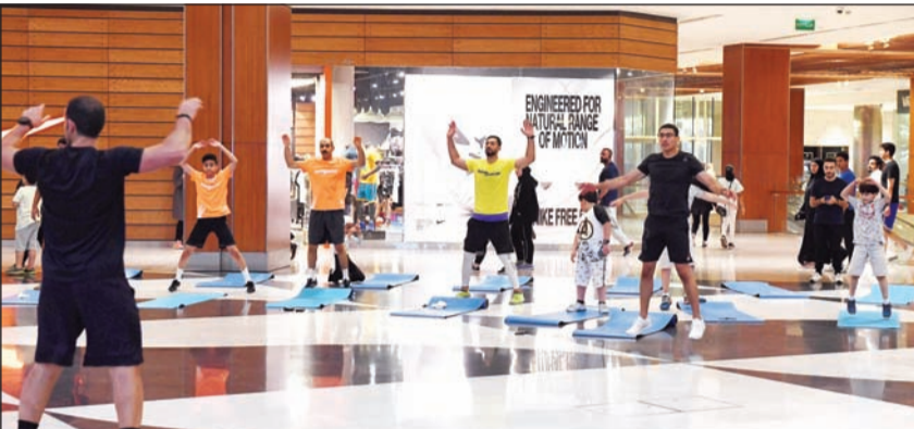
جانب من فعاليات رجيمي اليومية

منذ انطلاقها في شهر رمضان المبارك، أصبحت «رجيمي» برنامجاً رياضياً صحياً في شهر رمضان المبارك، والتي ينظمها مركز «رجيمي» في أول 20 يوماً من الشهر الفضيل من الأحد إلى الخميس من الساعة 4:45 مساءً وحتى 6 مساءً في مول 360 بهدف نشر التوعية بأهمية اتخاذ نمط حياة صحي ونشط خلال الصيام. وأوضحت الشركة في بيان صحافي أن شركائها الإستراتيجية لهذا البرنامج الصحي ما هو إلا ترجمة فعلية لاستراتيجيتها في مجالات المسؤولية الاجتماعية والاستدامة تجاه دعم الفعاليات والصحية وخاصة خلال شهر رمضان المبارك، حيث تقوم الشركة وبشكل دوري بتكثيف جهودها لنشر الثقافة الصحية في المجتمع بأحدث الوسائل والطرق للوقاية من الأمراض وتغذيتها، بالإضافة إلى عقد الشراكات الإستراتيجية مع المؤسسات الرياضية والطبية العامة والخاصة في الكويت بهدف المساهمة في رفع الوعي الصحي في المجتمع. وبينت «رجيمي» أنها جهزت العديد من المفاجآت لعملائها من خلال الأنشطة اليومية التي تصاحب انتهاء شهر رمضان المبارك. وأضافت الشركة أن برنامج «رجيمي» الصحي لهذا العام يشهد مشاركة العديد من خبراء التغذية المعتمدين من