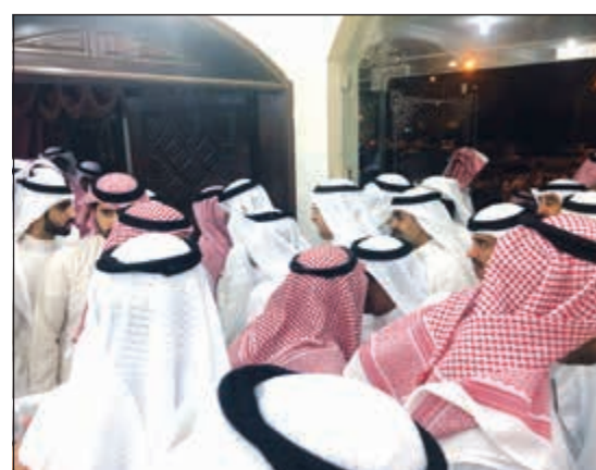
جانب من المهنيين