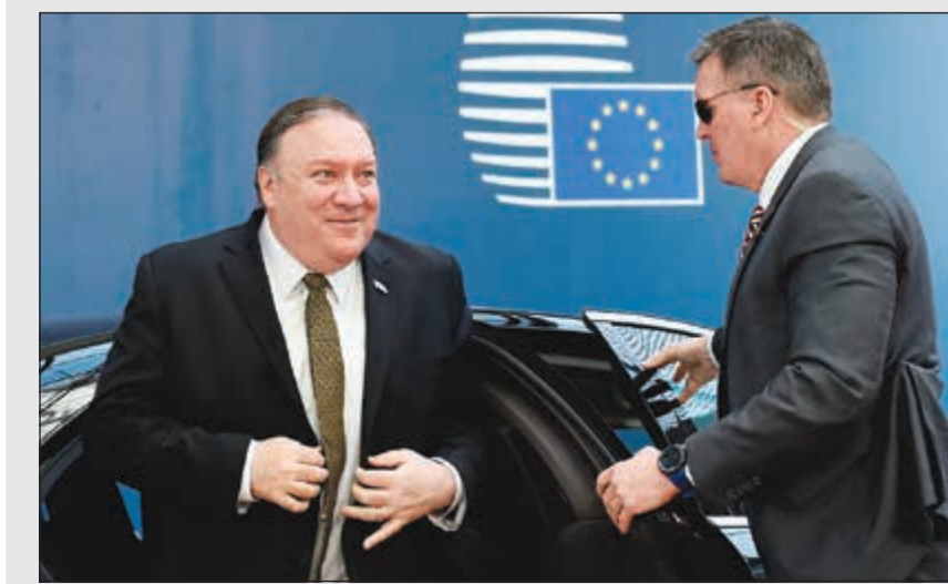
وزير الخارجية الأميركي مايك بومبيو لدى مقر الاتحاد الأوروبي في بروكسل أمس

جبري هانت من مخاطر نشوب حرب «غير مقصودة» بين الولايات المتحدة وإيران في ظل التوتر القائم بين البلدين. وقال هانت في تصريحات ألى بها من بروكسل على هامش الاجتماع الوزاري للشؤون الخارجية بالاتحاد الأوروبي: «أجرينا محادثات جيدة مع (وزير الخارجية الأميركي) مايك بومبيو أثناء تواجده في لندن الأسبوع الماضي. نحن قلقون للغاية من خطر حدوث تصعيد وصراع غير مقصودين من كلا الجانبين، وأضاف: «لهذا سنقوم بمشاركة هذه المخاوف مع نظرائنا الأوروبيين». وتابع بالقول: «ما نحتاجه هو فترة هدوء حتى يتسنى لكل شخص فهم ما يفكر فيه الطرف الآخر، والأهم من ذلك كله حتى نتأكد من عدم وضع إيران ثانية على مسار التسلسل النووي». وأوضح بالقول: «لأنه إذا ما أصبحت إيران قوة نووية، قد يدفع ذلك جيرانها لرغبة أن يصبحوا قوى نووية أيضا، تلك المنطقة هي بالأساس أكثر المناطق غير المستقرة في العالم».