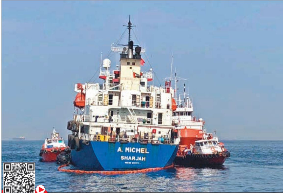
ناقلتا النفط مايكل التي تحمل علم الإمارات قبالة سواحل الفجيرة أمس

عواصم وكالات: ارتفعت العقود الآجلة للنفط أمس مدفوعة بتزايد المخاوف على الإمدادات من منطقة الشرق الأوسط، في الوقت الذي يتناب فيه القلق المستثمرين والتجار بشأن آفاق النمو الاقتصادي العالمي في ظل تعثر محادثات التجارة بين الولايات المتحدة والصين. وصعدت العقود الآجلة لخام القياس العالمي مزيج برنت تسليم يوليو بنسبة 1,41٪ أو 99 سنتا إلى 71,60 دولارا للبرميل. في الاتجاه نفسه، صعدت العقود الآجلة لخام الإمبريكي نايمكس تسليم يونيو بنسبة 1,01٪ أو 62 سنتا، إلى 62,27