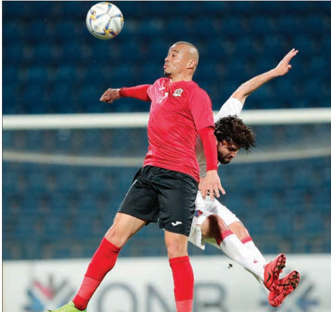
الكويت يسعى لتعويض خسارته امام الجزيرة الاردني والعبور للدور المقبل