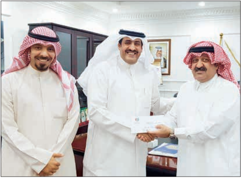
الشيخ أحمد اليوسف ود. أحمد عجب يسلمان مكافأة نادي الساحل لطلق الفتح

قام رئيس مجلس إدارة اتحاد كرة القدم الشيخ أحمد اليوسف أول من أمس بتسليم مكافآت الأندية صاحبة المراكز الثلاث الأولى في بطولة دوري السن العام للصالات وهي: الكويت البطل (15 ألف دينار)، وكاظمة الثاني (12 ألف دينار)، واليرموك الثالث (10 آلاف دينار)، وكذلك الأندية أصحاب المراكز الثلاثة الأولى لدوري السن العام لكرة الشاطئية وهي: العربي البطل (7 آلاف دينار)، والكويت الثاني (5 آلاف دينار)، ووزارة الكهرباء والماء الثالث (3 آلاف دينار).