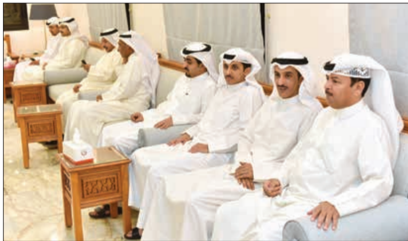
جانب من الحضور في ديوان الهيفي

أشار خلال حفل تكريم الجمعيات المتميزة إلى اجتماع بين «الشؤون» و«المزارعين» لحل مشكلة تفاوت أسعار الخضار