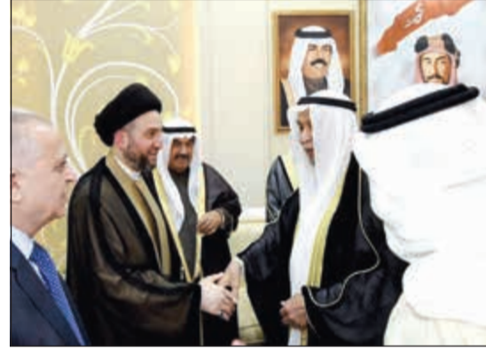
السيد عمار الحكيم مصاحبا د.خالد المذكور بحضور سمو الشيخ ناصر المحمد

وكان سمو الشيخ ناصر المحمد، قد استقبل الليلة قبل الماضية في قصر الشويخ، رئيس تيار الحكمة الوطني بجمهورية العراق الشقيقة سماحة عمار عبدالعزيز الحكيم، والوفد المرافق له بمناسبة زيارته للبلاد. حضر الاستقبال المستشار د.إسماعيل الشطي. وعقب الاستقبال أقام سموه غفقة رمضانية على شرف الضيف والوفد المرافق له.