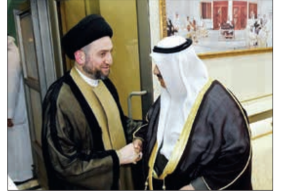
سمو الشيخ ناصر المحمد مستقبلاً عمار الحكيم