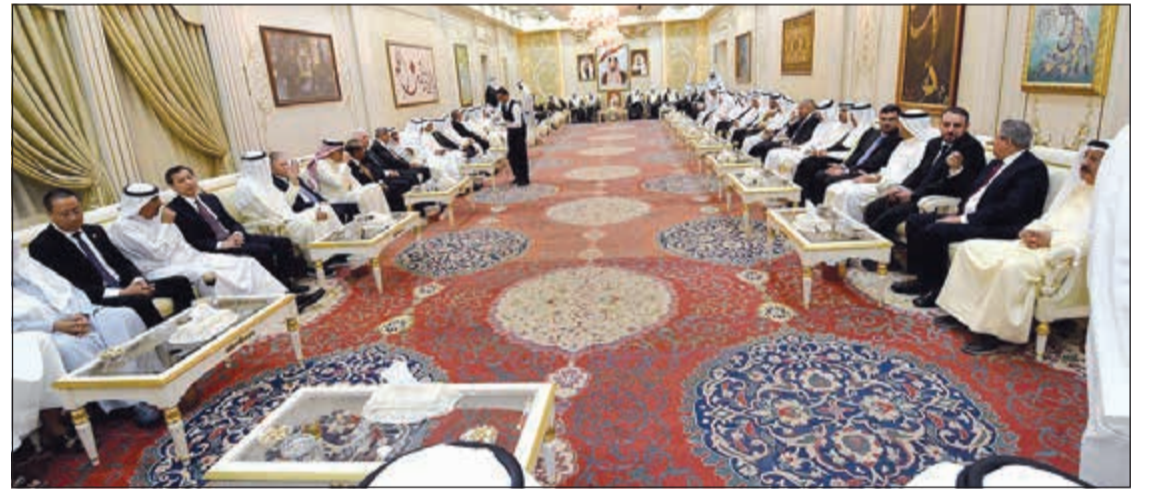
جانبا من الحضور في ديوان سمو الشيخ ناصر المحمد خلال الغفقة التي أقامها سموه على شرف السيد عمار الحكيم