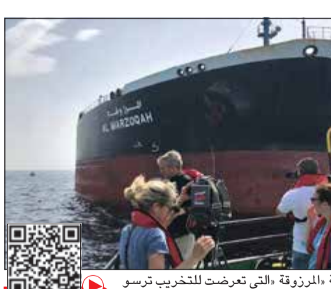
ناقلة النفط السعودية «المرزوقة» التي تعرضت للتخريب ترسو في ميناء الفجيرة

عواصم - وكالات: صبت «الاعتداءات التخريبية»، التي تعرضت لها 4 سفن قرب ميناء الفجيرة لولاية الإمارات الزيت على نار التوتر المؤججة في المنطقة أصلا بفعل التصعيد بين الولايات المتحدة وإيران. وأعرى مصدر مسؤول في وزارة الخارجية عن إدانة واستنكار الكويت والشعبيين للاعتداءات. وقال إن «هذا العمل الإجرامي يعد انتهاكا صارخا للقانون الدولي، الأمر الذي يتحتم معه تحرك سريع من المجتمع الدولي لوضع حد لغلل هذه الأعمال».. وكان وزير الطاقة والثروة المعدنية السعودي خالد الفالح أكد «تعرض ناقلتي النفط سعوديتين لهجوم تخريبي»، لكنه أكد عدم وقوع أي إصابات أو تسرب «في حين نجمت عنه أضرار بالغة في هيكلتي السفينتين». وسبق ذلك إعلان الإمارات أن 4 سفن شحن تجارية تعرضت له «عمليات تخريبية» شرق إمارة الفجيرة قبالة إيران، واصفة الحادث بأنه «خطير»، ومؤكدة فتح تحقيق. ووسط إدانة دولية ودعوات لحماية خطوط الملاحة الدولية، عبرت طهران عن «القلق» لوقوع هذه الأعمال التخريبية، وحثت على إجراء تحقيق، متهمه «مخربين من دولة ثالثة بتفخيدها لزعة استقرار المنطقة».. التفاصيل ص 40