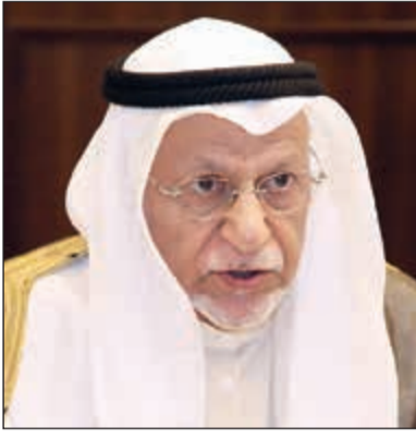
عبد الوهاب الزواهي النائب الأول لرئيس غرفة تجارة وصناعة الكويت

زاوية رمضانيتها تعدها 'الانباء' مع مسؤولي الشركات وأصحاب القرار بالاقتصاد الكويتي يتحدثون فيها عن تجاربهم الخاصة بعالم الاقتصاد، ويشاركون الفراء العبر والدروس منها