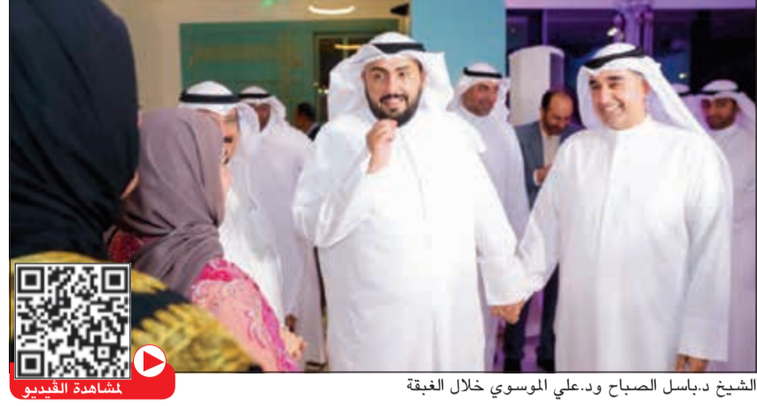
الشيخ د.باسل الصباح ود.علي الموسوي خلال الغبقة

وكشف الوزير عن تطبيق الملف الإلكتروني لجميع المستشفيات والمراكز الصحية والتخصصية قريبا، وتوجيهها الى ملف واحد، مشيراً إلى أن إلزام الأطباء والهيئة التمريضية والطبية المساندة بدورات الإنعاش القلبي والرئوي يصب في مصلحة المرضى.