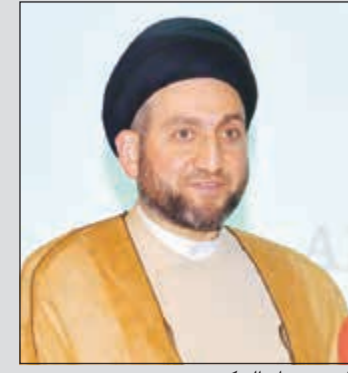
السيد عمار الحكيم