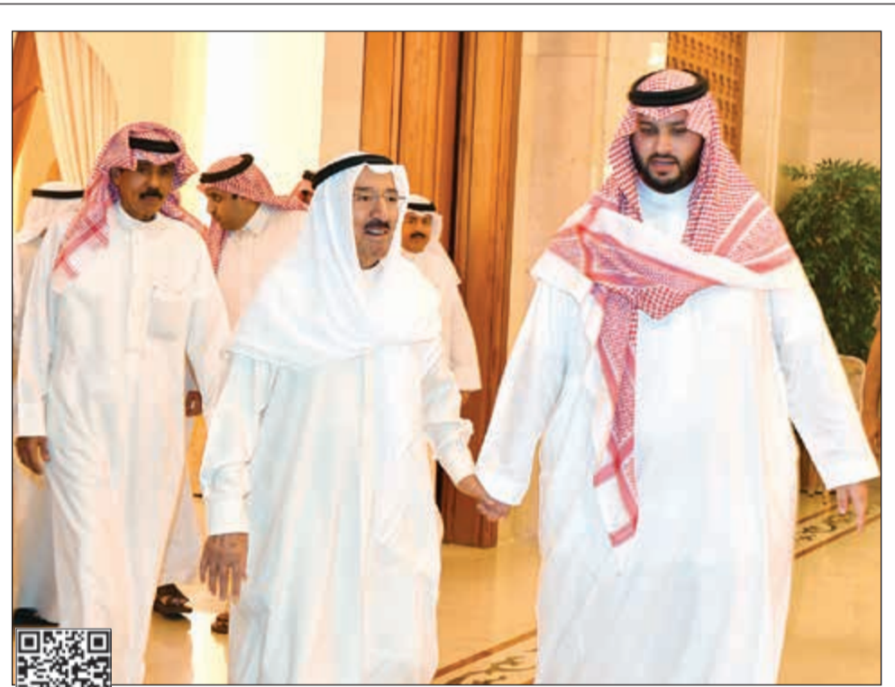
صاحب السمو الأمير الشيخ صباح الأحمد لدى استقباله صاحب السمو الملكي الأمير تركي بن محمد بن فهد آل سعود بحضور سمو ولي العهد الشيخ نواف الأحمد

من جانب آخر، أوضح الغانم أن مكتب المجلس ناقش أمس الأول الأربعاء جدول أعمال الجلسات لما تبقى من دور الإنعقاد الجاري، حيث سيتم عقد 6 جلسات للميزانيات في شهر يونيو المقبل بالإضافة إلى تخصيص جلسات للانتقاء من بعض القوانين. وأعلن الرئيس الغانم أن الحكومة أبلغته اليوم «امس» أنها لن تحضر الجلسة الخاصة التي تم توجيه الدعوة لعقدتها الأحد المقبل، مشيرا إلى أن الحكومة بررت موقفها هذا بعدم