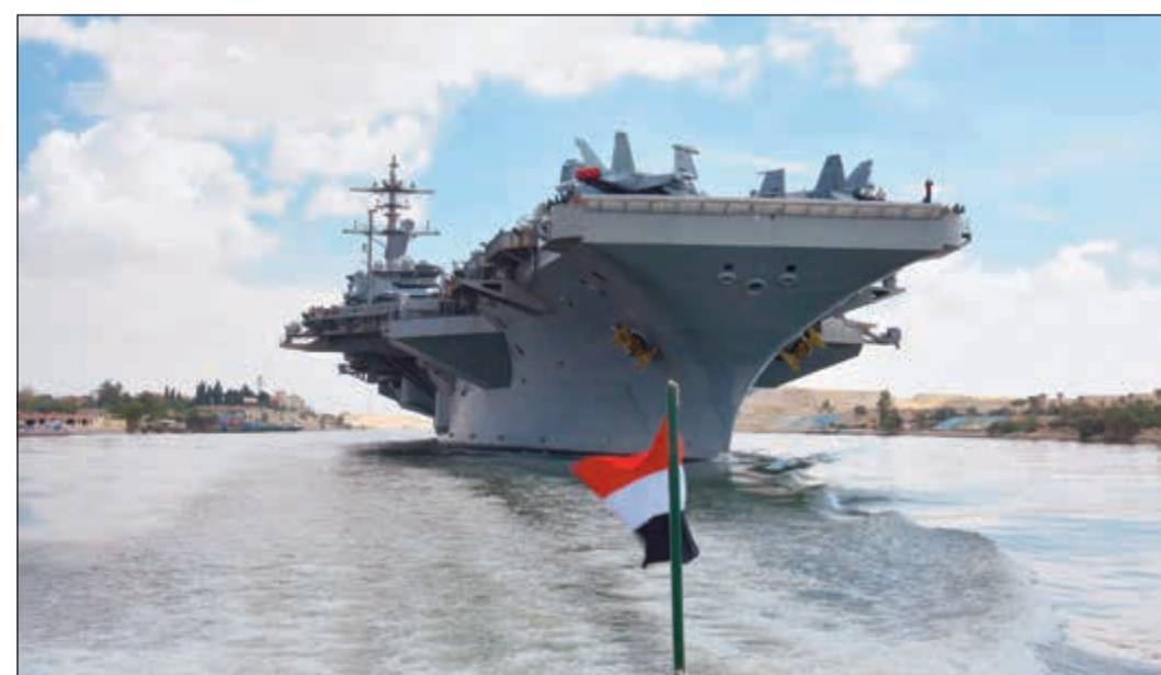
حاملة الطائرات الأميركية أبراهام لينكولن لدى عبورها قناة السويس في طريقها إلى الخليج

عواصم - وكالات: ارتفع مستوى التوتر والتصعيد بشأن أزمة الاتفاق النووي الإيراني مع مواصلة الولايات المتحدة الحشد العسكري للرد على ما تصفه بـ«التحديات الإيرانية»، فيما رفضت أوروبا «مهلة» الـ 60 يوما التي حددتها طهران بشأن الاتفاق، داعية إيها إلى الالتزام ببنوده والامتناع عن أي تصعيد. وعبرت حاملة الطائرات الأميركية «أبراهام لينكولن» قناة السويس أمس متجهة إلى الخليج، فيما تجري واشنطن مشاورات لإعادة نشر بطاريات منظومات «باتريوت» الصاروخية، التي سحبتها العام الماضي. وبالتوازي، شددت إدارة الرئيس دونالد ترامب من ضغوطها الاقتصادية على إيران، وفرضت عقوبات إضافية على