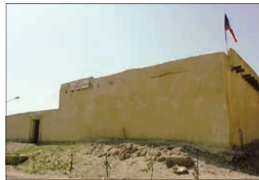
«بيت الصندلي»... قيمة تراثية كبيرة

الوطني للثقافة والفنون والآداب طلب نقل تبعية «بيت الصندلي» باعتباره من المباني التاريخية لترميمه وإعادة افتتاحه كمتحف أو مركز ثقافي، حيث إنه يقع بجانب «بحرة سيليل» ويعد من أقدم بيوت الجوهراء، مشيرا إلى أنه يقع خارج التنظيم العام بموجب القانون رقم 18 / 96. ولفت المنفوحى إلى أن العقار تم ترميمه على عدة مراحل.