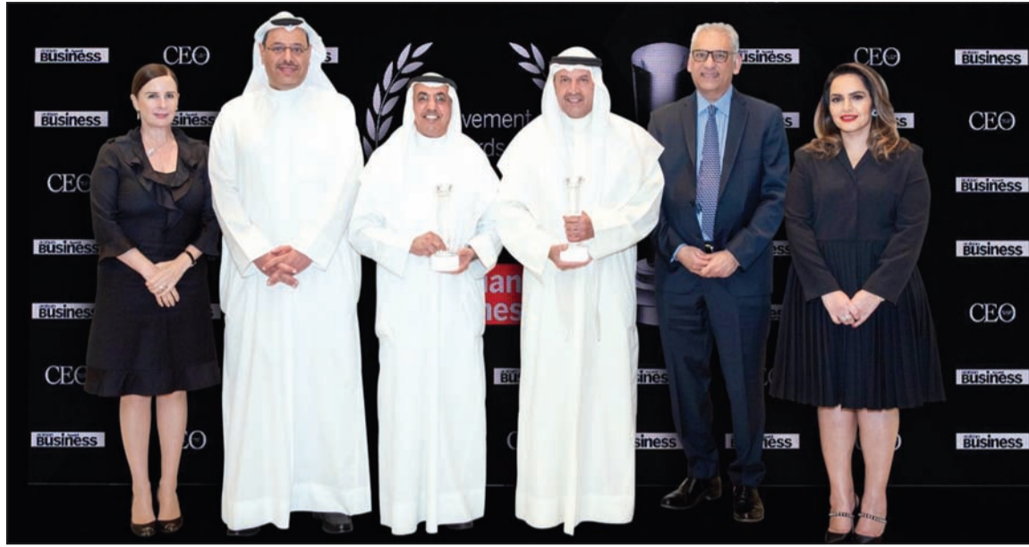
جانب من حفل تسلم «الأهلي الكويتي» الجائزة من مجلة أريبيان بزنس

قائم على تكنولوجيا حرق هذه المخلفات وتحولها إلى طاقة كهربائية برأس المال يفوق الـ 60 مليون دينار. ونحن كذلك في المراحل الأخيرة لإجراءات توقيع الاتفاقيات مع المستثمر الذي تم اختياره كمستثمر مفضل. بالإضافة لمشروع عقاري خدمي استثماري في منطقة العقيلة». وأوضح الصانع أن تأخر الطرح العام لشركة «شمال الزور» عائد لأسباب إجرائية، وأكد أن الإعلان عن الطرح العام لشركة «شمال الزور» سيكون في وقت قريب، وأن الخلاف مع المستثمرين في «شمال الزور» تم حسمه.