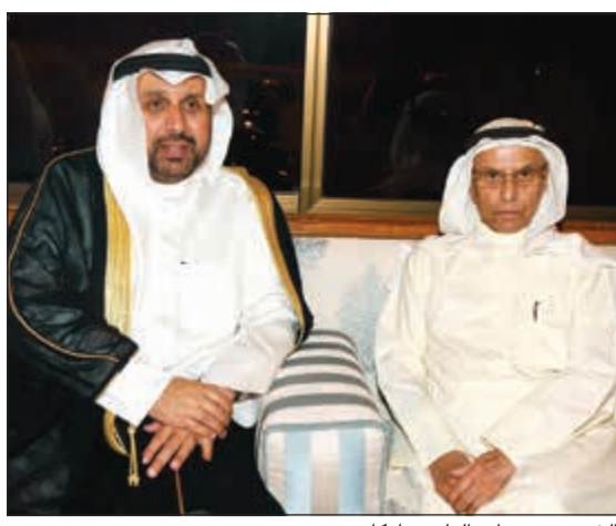
الشيخ حمد جابر العلي مباركا

التنفيذ تتضمن توزيع مائة ألف وجبة قبل الإفطار بعشر دقائق خلال 20 يوماً من شهر رمضان، مشيراً إلى أن الحملة تعبر عن تكاتف أبناء الكويت وحبهم للخير، فكل الشكر والتقدير للشريك الاستراتيجي ممثلاً في وزارة الداخلية وتعاونها لإنجاح هذه الحملة. وذكر السيف أن مركز العمل التطوعي يقوم بتنفيذ الحملة من خلال متطوعيها ويفتح بذلك مجالاً جديداً للتطوع الذي يحقق الأمن والسلامة للمواطنين والمقيمين خلال شهر رمضان، لافتاً إلى أن هذا يحقق بذلك رؤية ورؤية المركز تحت رئاسة الشيخة أمثال الأحمد. وتوجه بالشكر للشركات الراعية، مؤكداً أنه لولاها ما استطعنا تنفيذ هذه الحملة ومنهم: مجموعة الملا ومجموعة السابور القابضة وبيت التمويل وشركة مطاحن الدقيق، ولا يخفى عليكم دور الراعي الإعلامي الذي سخر وسائله المرئية والمسموعة والمكتوبة لتغطية أعلن مركز العمل التطوعي وفريق «نهتم» عن إطلاق الحملة الرمضانية «رمضان أمان» لهذا العام تحت شعار «معا رمضان بلا حوادث» وذلك خلال مؤتمر صحفي في مركز شباب الشامية بمشاركة العديد من الهيئات والمؤسسات والشركات دعماً لتلك الحملة التي تعد من الصور المشرفة للكويت وتعتبر عن مدى تكاتف أبنائها وما جيلوا عليه من تطوع وحب الخير وتغطي جميع المحافظات بالتعاون مع وزارة الداخلية والهيئة العامة للشباب وبمشاركة مئات الشباب من المتطوعين. وفي هذا السياق قال المنسق العام لحملة «رمضان أمان» ورئيس فريق «نهتم» التابع لمركز الكويت للعمل التطوعي، صلاح السيف: للعام الثالث على التوالي تنطلق حملة «رمضان أمان» بالتعاون مع وزارة الداخلية حيث تغطي الحملة كل المحافظات وبخطة محكمة