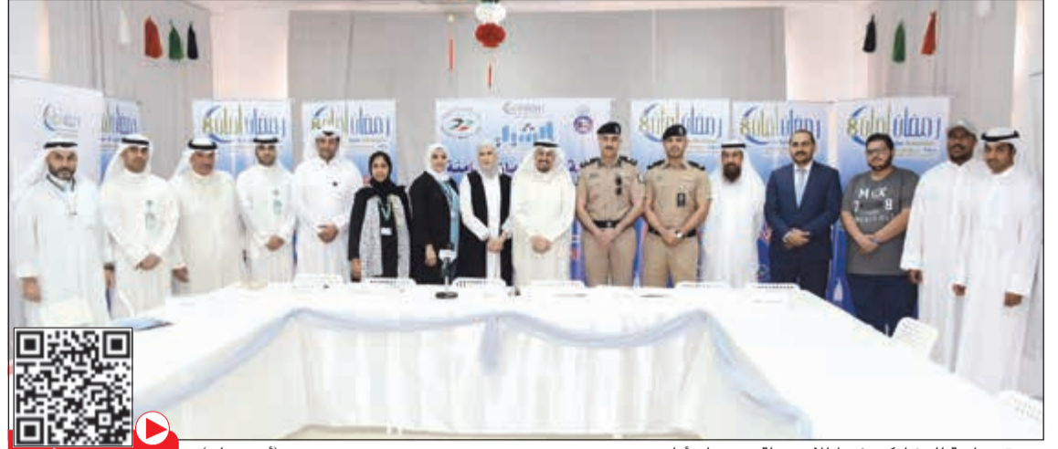
صورة جماعية للمشاركين في إطلاق حملة «رمضان أمان» (أحمد علي) لمشاهدة الفيديو