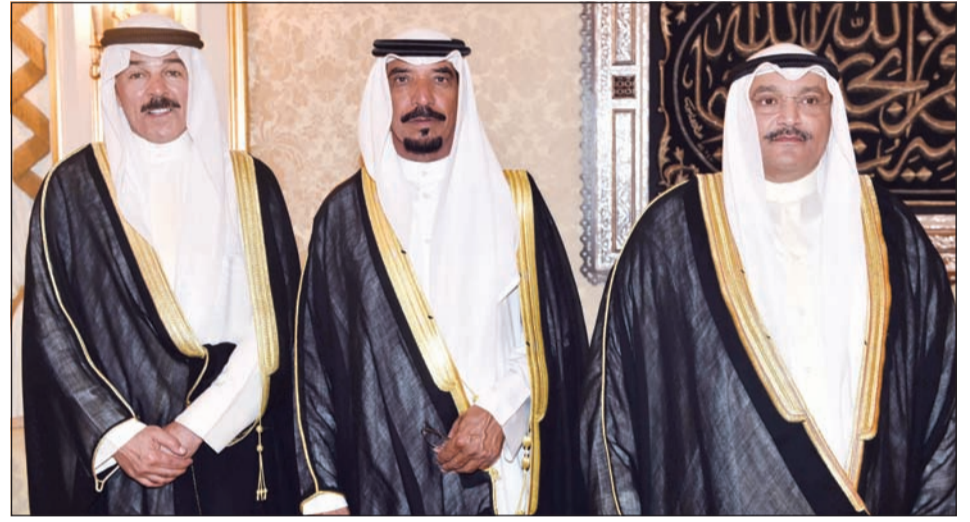
الشيخ محمد خالد مباركا بـرمضان

جرباً على عادته السنوية، استقبل ديوان قصر الشعب مساء أول من أمس جموع المهنيين بشهر رمضان المبارك. وقد اكتظ الديوان بـلغيف من الشيوخ وكبار الشخصيات وعدد من المواطنين والمقيمين، حيث تبادل الحضور أطراف الأحاديث الودية في جو من الألفة والمحبة، داعين المولى عز وجل أن يعيد هذا الشهر الفضيل على الأمّتين العربية والإسلامية عامة وأهل الكويت خاصة بالخير والسلام.