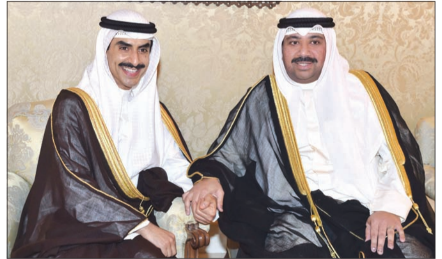
الشيخ ناصر الجابر مباركا