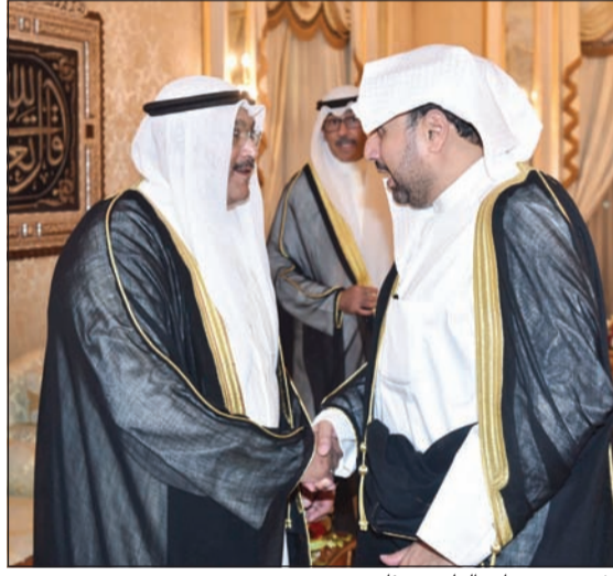
الشيخ حمد جابر العلي مهنّتا