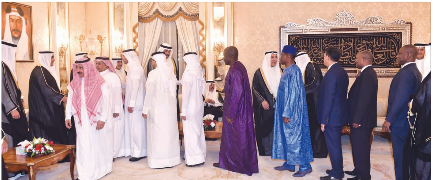
عدد من الحضور والديبلوماسيين يهنئون