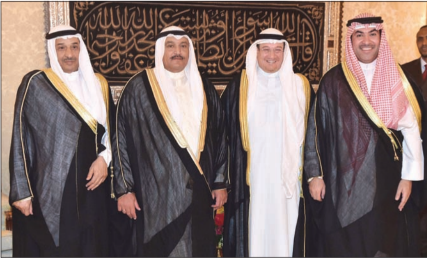
الشيخ مبارك سالم العلي مهنّتا