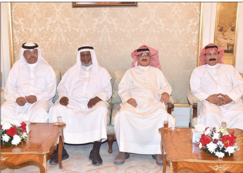
عدد من المهنيين في قصر الشعب