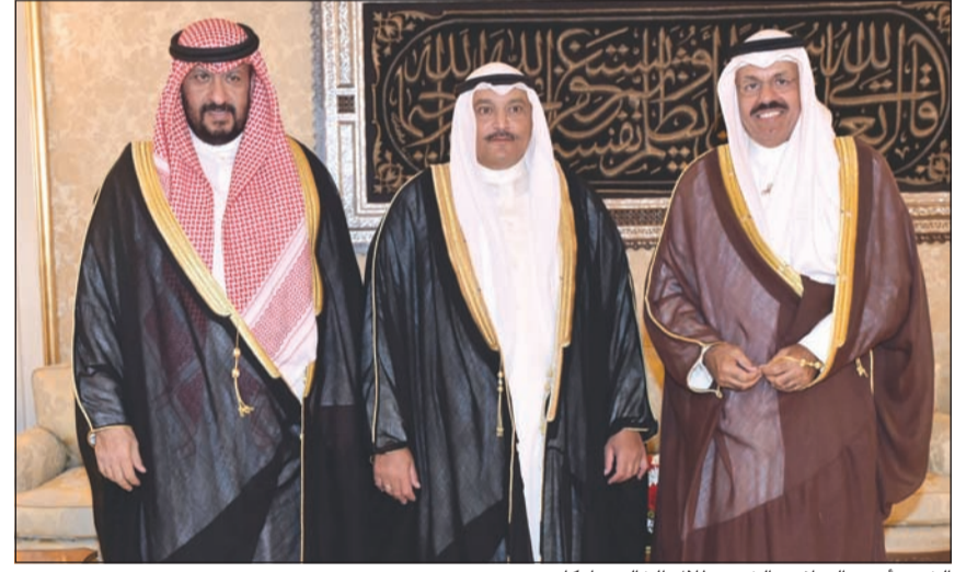
الشيخ أحمد النواف والشيخ طلال خالد يباركان