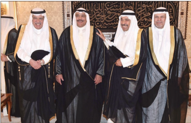
عبدالعزيز البابطين مباركا بـرمضان