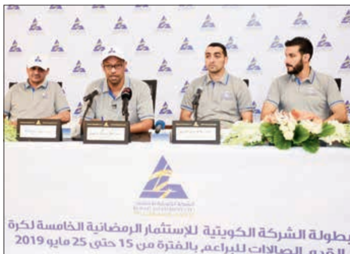
جانب من المؤتمر الصحافي للبطولة