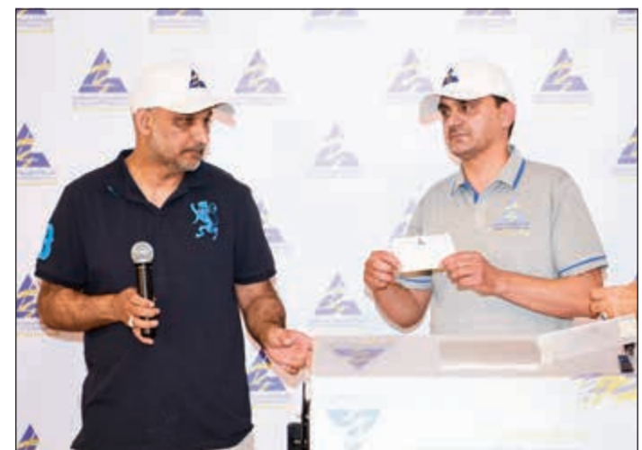
جانب من عملية سحب القرعة

وفرق مدرسة النبراس والمرحوم الفنان عبدالعزيز المنصور والمرحوم الفنان خالد الصديق. وأكد الرشدان أن الشركة تهدف في المقام الأول من خلال إقامة البطولة الرمضانية إلى كشف النقاب عن لاعبين مهووبين وتقديمهم للأندية الرياضية إلى جانب صقل موهبتهم وتوفير الاحتكاك اللازم لهم، مضيفا أن أهم ما يميز البطولة في نسختها الخامسة هو مشاركة العديد من الفرق من خارج البلاد وتحديدًا من مصر وتونس والإمارات وقطر وسلطنة عمان والأردن وتركيا. وأشار الرشدان إلى أن النسخة الخامسة شهدت مضاعفة عدد الفرق المشاركة في البطولة، وذلك بمشاركة 27 فريقا يمثلون أندية وأكاديميات رياضية من مواليد 2006 و2007 إلى