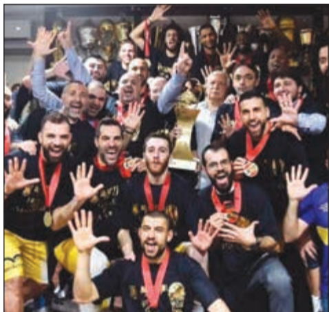
بيروت - ناجي شربل

استعاد النادي الرياضي بيروت لقب بطولة لبنان في كرة السلة وعزز رقمه القياسي في عدد مرات الفوز بالبطولة إلى 28 بينها 15 في العصر الحديث للعبة منذ تسعينيات القرن الماضي، بعدما تقدم منافسه بيروت 2-4 في سبوع مباريات ممكنة في الدور النهائي، بفوزه عليه في المباراة السادسة من هذه السلسلة في قاعة صائب سلام في المنارة بفارق ست نقاط 89-83. اصغر المدرب اللبناني الذي يفوز بالبطولة، وسبق للرياضي إحرار مسابقة كأس لبنان هذا الموسم بفوزه على هومنتن بيروت بطل الفائتة الموسم الماضي.